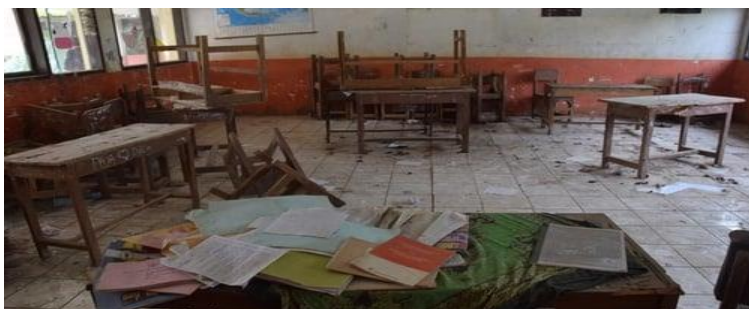
Gambar 2 .Kerusakan Media Dan Alat Sekolah SMP N 4 Pasaman