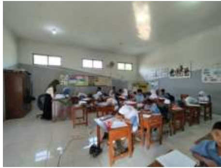
Gambar 1.2 Kegiatan Pretes