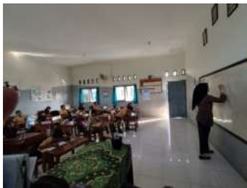
Gambar 1.3 Kegiatan Postes

Setelah melakukan kegiatan pretes di pertemuan ke I kemudian pada pertemuan ke II pada tanggal 4 Agustus 2023, selanjutnya peneliti menerapkan metode bermain peran ( Role Playing ). Peneliti melaksanakan metode bermain peran sesuai dengan sintaks pembelajaran didalamnya dan sesuai dengan materi pembelajaran teater kemudian diakhir pembelajaran peneliti melakukan kegiatan posttes untuk mengetahui kemampuan kognitif siswa khususnya pada mata pelajaran bahasa Indonesia. Siswa lebih antusias dengan metode yang diterapkan oleh peneliti sebagai contoh AF berani menjawab pertanyaan dari peneliti. Kegiatan post tes di pertemuan II ini dapat dilihat pada gambar dibawah ini.