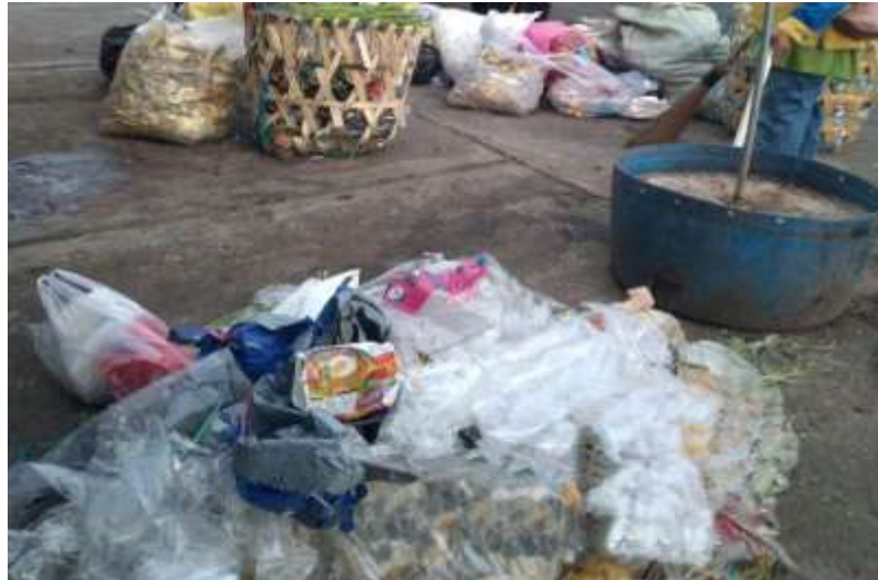
Gambar 3. Pengumpulan sampah

Pengumpulan dapat dilakukan dengan menyediakan tempat penampungan sampah sementara, hal ini sejalan dengan penelitian yang dilakukan Fikriyah, et al (2022) bahwa penyediaan tempat penampungan sampah sementara sangat penting dalam penanganan sampah khususnya mencegah perilaku membuang sampah yang tidak tepat kemudian menyebabkan pencemaran. Dampak dari belum terpenuhi kebutuhan pelayanan persampahan akan menyebabkan masalah seperti timbulan sampah yang tercerai sehingga menurunkan estetika dan pencemaran terhadap lingkungan (Achmad et al . 2015).