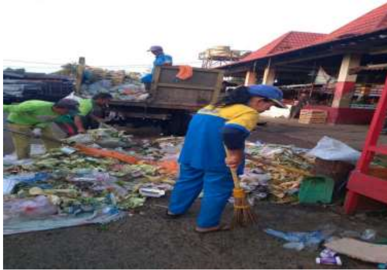
Gambar 4. Pengangkutan Sampah