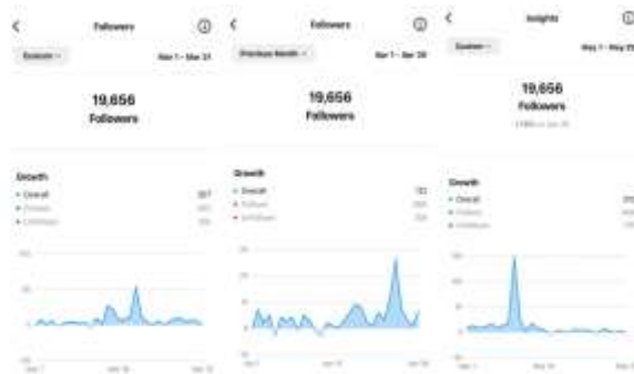
Gambar 6. Insight followers per tiga bulan

Maka, keefektifitasan media sosial Instagram berdasarkan engagement rate :