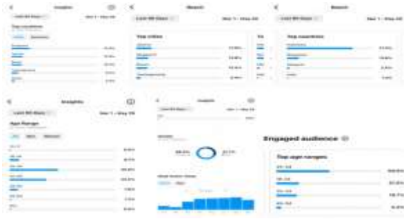
Gambar 2. Tingkat kunjungan visitor instagram Natra Bintang