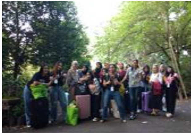
Gambar 2. Kegiatan Pertukaran Mahasiswa

Program Pertukaran Mahasiswa Merdeka (PMM) angkatan 2 di Universitas Atmajaya Yogyakarta (UAJY) dilakukan pada bulan Agustus hingga Desember 2022. Mahasiswa luar pulau yang mengikuti Program PMM di UAJY disebut dengan mahasiswa inbound. Universitas PGRI Madiun mengelola dua kelompok mahasiswa Modul Nusantara yang berjumlah 40 mahasiswa yang berasal dari berbagai perguruan tinggi di Indonesia. Modul Nusantara memiliki kegiatan sebanyak 25 kegiatan, diantaranya 14 kegiatan kebhinekaan, 7 kegiatan refleksi, dan 3 kegiatan inspirasi, serta kegiatan kontribusi sosial (Ferrijana et al., 2017). Kegiatan Modul Nusantara yang dilakukan bertujuan agar seluruh mahasiswa di Nusantara dapat mengenal, dan berkunjung langsung ke lokasi-lokasi sejarah, Budaya dan kesenian yang ada di Madiun dan sekitarnya.