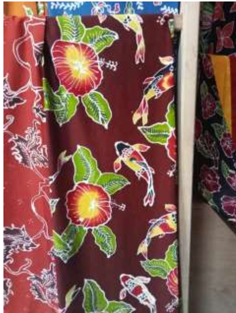
Gambar 2: batik ikan koi dan bunga sepatu produksi batik BALITAR

Beberapa kain batik yang dibuat menggunakan motif ikan koi dengan motif pendukung dan isen-isen yang sangat jarang, berbeda dengan batik dari Solo atau Jogja yang penempatan setiap unsur motifnya memenuhi kain. Pengrajin batik saat ini banyak yang membuat inovasi dan kreasi supaya motif yang dibuat lebih menarik tanpa mengurangi nilai-nilai dibalik motif tersebut, namun berbeda dengan batik kota Blitar yang motifnya masih berbentuk naturalis tanpa pengayaan sama sekali.