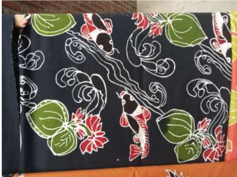
Gambar 1: batik ikan koi produksi batik BALITAR