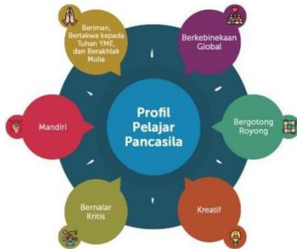
Gambar 1. Dimensi Profil Pelajar Pancasila (Kurniawaty et al., 2022) dan (Rahma et al., 2023).

Siswa Indonesia dapat berkontribusi pada pembangunan global yang berkelanjutan dengan mengatasi berbagai tantangan, seperti: 1. Memiliki iman, rasa takut dan akhlak mulia; 2. Keanekaragaman global; 3. Bekerja sama; 4. Mandiri; 5. Pemikiran kritis; dan 6. Kreatif. Di antara aspek-aspek tersebut terlihat bahwa profil Pancasila tidak hanya berfokus pada kemampuan kognitif, tetapi juga pada sikap dan perilaku yang sesuai dengan jati dirinya sebagai warga negara Indonesia dan warga dunia (Rahma et al., 2023) (Kurniawaty et al., 2022) (Hidayah et al., 2021). Profil ini dapat digambarkan sebagai berikut;