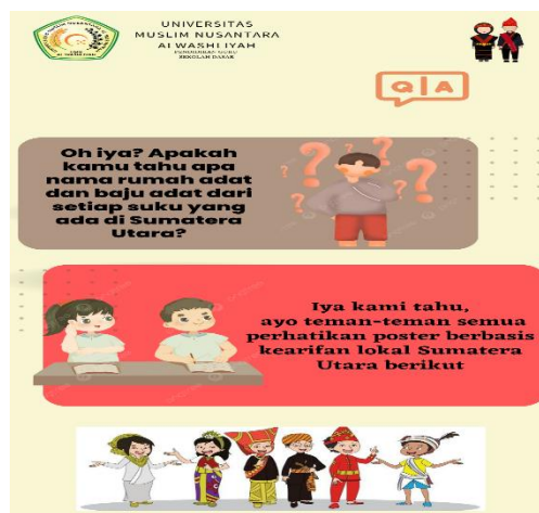
Gambar 4.3 Pertanyaan Kearifan Lokal Sumatera Utara