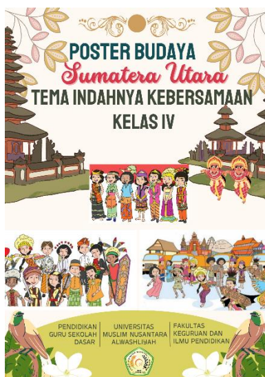
Gambar 4.5 Tampilan Cover Belakang Poster