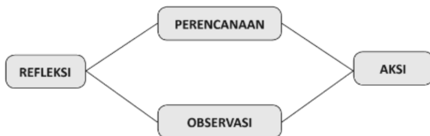
Gambar 1. Penelitian Tindakan Kelas Model Kurt Lewin

Pada penelitian ini, metode penelitian yang digunakan yaitu, metode Penelitian Tindakan Kelas (PTK) dengan model Kurt Lewin. PTK dengan model Kurt Lewin terdiri atas empat tahapan yaitu, perencanaan, pengamatan, pelaksanaan serta refleksi. Tahapan-tahapan tersebut digambarkan menjadi suatu proses (Mu'alimin, 2014). Gambarnya dari keempat tahapan tersebut sebagai berikut: