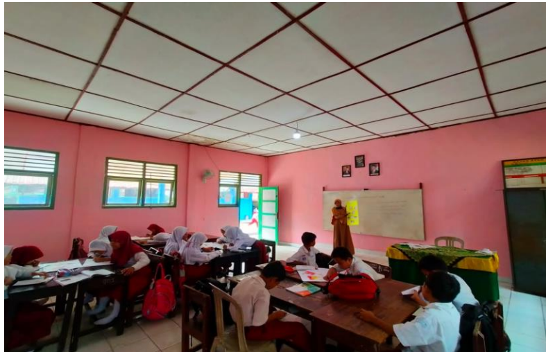
Gambar 4.6 Penyampaian Materi pokok dan tujuan pembelajaran sumber (Ananda, 2023)

Langkah selanjutnya yaitu guru menyampaikan materi atau penjelasan tentang bagaimana proses pembuatan peta yang akan dilakukan secara bersama guru menjelaskan tahap- tahap yang harus dilakukan siswa dalam proses pembuatan project peta dengan cara menjelaskan materi sehingga siswa bisa berpikir untuk dapat membuat peta dari proses penjelasan guru. Guru disini memberikan gambaran supaya siswa mampu berpikir dalam membuat sebuah project mengenai materi jalur masuk bangsa Eropa ke Indonesia. Adapun materi yang disampaikan guru yaitu tentang negara negara Eropa yang menjajah Indonesia yaitu Portugis, Inggris, Spanyol dan Belanda proses kedatangannya yaitu melalui jalur lautan yang mana tujuannya untuk menguasai perdagangan rempah-rempah atau terkenal dengan 3c.