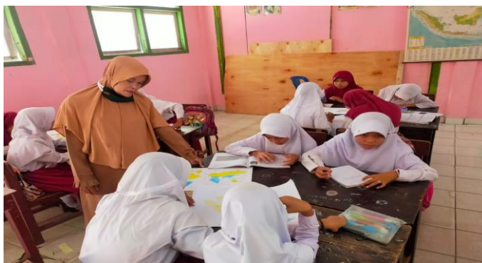
Gambar 4.9 Guru memonitoring siswa dalam pembuatan proyek

alam Proses pembuatan proyek tak lupa guru memonitoring siswa dan melihat secara langsung bagaimana proses pembuatan peta jika dilakukan oleh siswa, siswa dapat berkolaborasi pembuatan project mereka saling bantu satu sama lain, dalam proses pembuatan project disini guru hanya sebagai fasilitator atau tutor yaitu hanya mengarahkan siswa dalam proses pembuatan proyek untuk melihat bagaimana kondisi siswa dalam pelaksanaan pembelajaran yang diterapkan menggunakan model project based learning siswa mampu bekerjasama dan aktif dalam proses pembelajaran sehingga proses pembelajaran lebih efektif. Disini guru melihat secara langsung tahap- tahap siswa dalam proses pembuatan project untuk melihat sejauh mana siswa dapat bekerjasama dengan siswa yang lain, hal ini untuk melihat siswa dalam keterampilan abad 21, yang mana dalam pembuatan project siswa menumbuhkan keterampilan abad 21 yaitu salah satunya kreatif dalam proses pembelajaran.