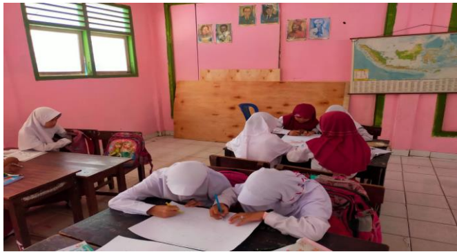
Gambar 4.10 proses kolaboratif siswa dalam pembuatan peta

Dapat dilihat dari keterangan foto diatas dalam proses pembuatan peta peserta didik mampu bekerjasama dan saling membantu satu dengan yang lainnya dalam proses pembuatan peta. Siswa kreatif dalam pembustan project terlihat siswa mewarnai peta sehingga tampilan peta nya sangat menarik hal ini tentu dapat membuat siswa berekmbang sesuai dengan keterampilan abad 21 siswa aktif dan dapat kolaboratif yang mana siswa bekerjasama dalam menyelesaikan project yang dibuat.