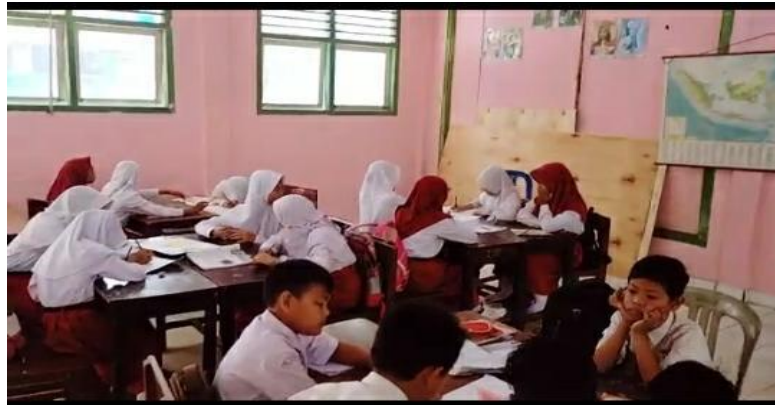
Gambar 4.6 Pembagian Kelompok Siswa