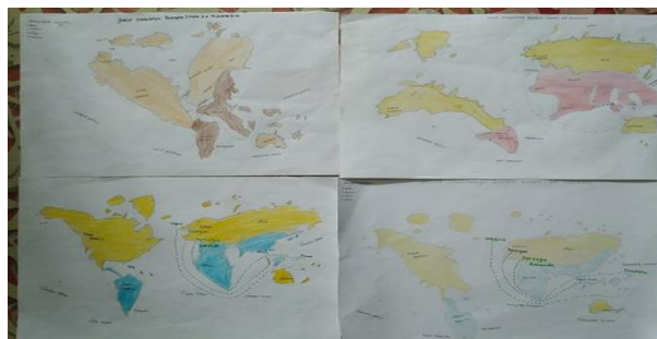
Gambar 4.10 hasil project yang telah dibuat secara kelompok

Hasil project peta yang telah dibuat oleh siswa yaitu peta jalur masuknya bangsa Eropa ke Indonesia, siswa membuat peta secara berkelompok yang terdiri dari 4 kelompok hasil project peta terlihat siswa sangat senang dalam proses