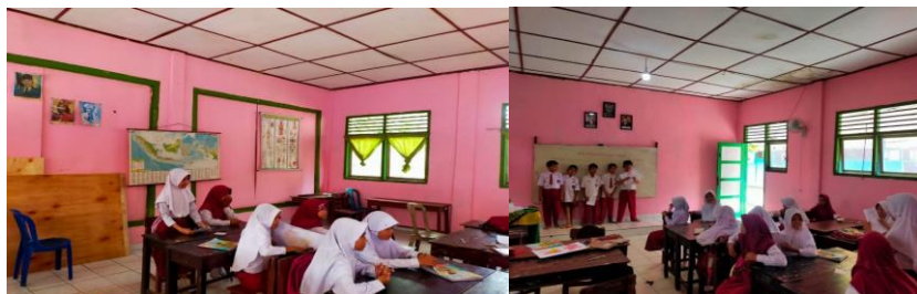
Gambar 4.11 Pemaparan hasil project peta

Setiap kelompok diberi kesempatan untuk mempresentasikan hasil proyek yang mereka kerjakan, dan guru meminta agar setiap kelompok melakukannya project yang mereka buat bersama sama dapat hal ini tentunya membuat proses belajar mengajar lebih aktif karena seluruh siswa aktif dan terlibat dalam proses pembuatan project , masing masing kelompok memaparkan hasil, dan mereka ada sesi tanya jawab ini yaitu siswa mampu berkomunikasi yang baik / collaboration sesuai dengan ciri pembelajaran abad 21 yang mana setiap perwakilan kelompok bertanya kepada kelompok yang memaparkan hasil project hal ini tentu membuat siswa collaboration dan mampu berkomunikasi yang baik dalam setiap proses tanya jawab.