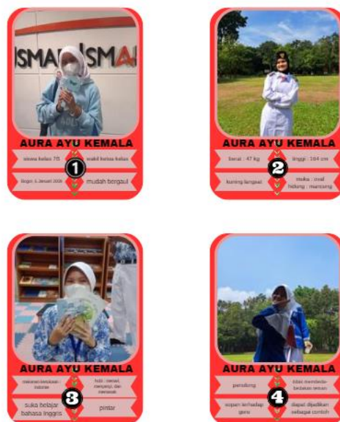
Gambar 3 Contoh Kartu Objek

Dari tabel di atas dapat dilihat bahwa terdapat kenaikan nilai siswa dalam menulis teks deskripsi dengan menggunakan metode discovery learning melalui media kartu objek.