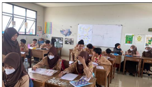
Gambar 4 Pelaksanaan Posttest Menulis Teks Deskripsi