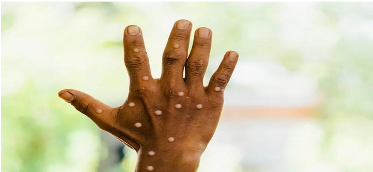
Gambar 2. Cacar Monyet

melalui air liur yang masuk ke mata, hidung, dan juga mulut. Akan tetapi imun manusia dalam tersebarnya virus ini cukup lambat, sehingga jarang terjadi ketika tidak adanya kontak intens antar satu sama lain. Masa inkubasi virus ini yakni infeksi dari adanya gejala yang berlangsung antara 6 – 16 hari, dan juga sekitar 5 – 21 hari. Gejala dari adanya virus ini yakni ada beberapa fase, pertama fase prodromal yakni adanya infeksi sebelum ruam atau lesi kulit dan fase ini mirip dengan cacar air atau flu, fase ini dapat terjadi hingga demam tinggi di atas 38,5 derajat celsius, sakit kepala, nyeri otot, lemah lesu, pembekakan kelenjar getah bening, mengigil, sakit punggung, mual dan muntah. Kedua, fase erupsi yakni 1-4 hari setelah fase pertama, fase ini akan terjadi makula atau bercak merah yang muncul di kulit, papula benjolan kecil di permukaan kulit, vesikel benjolan yang berubah menjadi lepuhan cairan jernih mirip cacar air, pustula cairan lepuhan yang berubah menjadi nanah, dan keropeng yakni lesi mulai mengering dan membentuk keropeng yang akan melupas dan meninggalkan bekas luka (Dimas 2020).