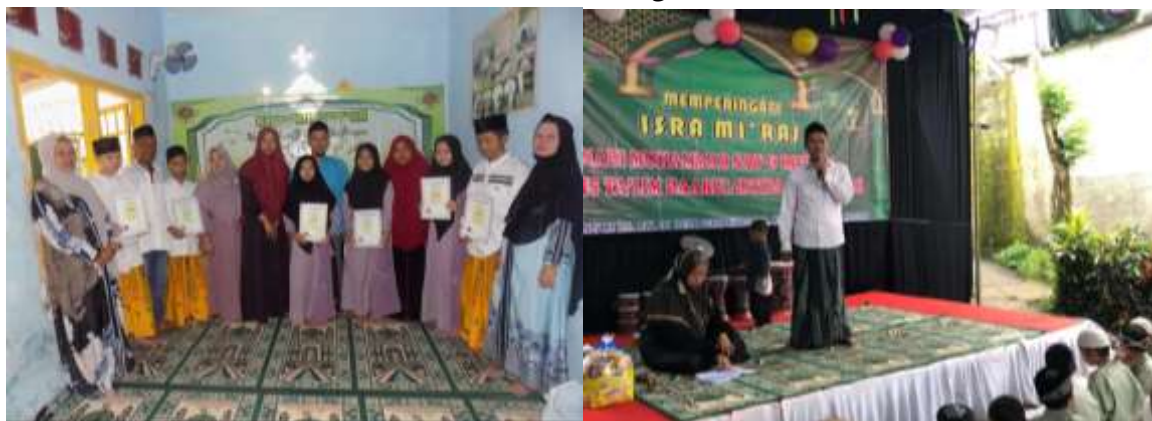
Gambar 2. Kegiatan Keagamaan Daarul Ibtida' Al-Hasanah

"Kalau Maulid, Daarul Ibtida' Al-Hasanah suka bikin tenda di luar, masak bareng-bareng... dari mereka untuk mereka." (LA, Desa Cihideung Ilir, 9/11/2025).