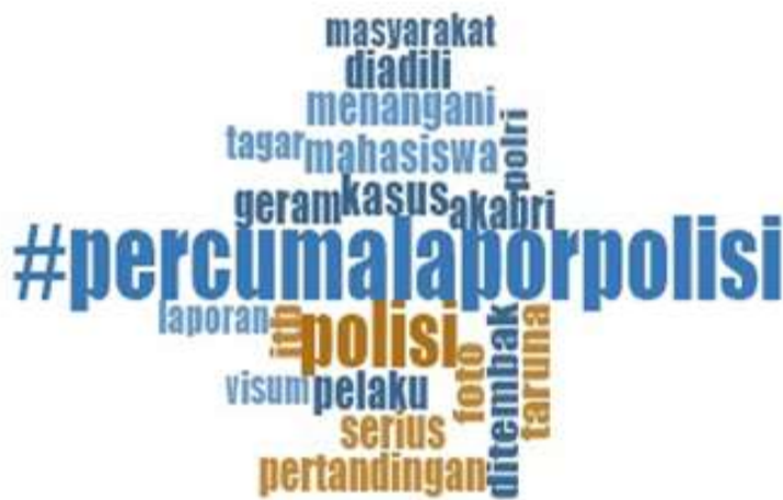
Gambar 2. Visualisasi wordcloud untuk kata-kata yang sering digunakan #percumalaporpolisi

Wawasan akurat dari media sosial seperti Twitter, dapat diperoleh jika pengguna melihat tweet yang muncul di Twitter setiap hari. Karena banyaknya tweet dan pertumbuhan yang cepat, tidak mungkin melakukan ini secara manual tanpa bantuan alat berbasis komputer. Peneliti menggunakan teknik pengumpulan data yang ditangkap melalui Ncapture sehingga menghasilkan data yang berisi berbagai kegiatan yang dilakukan dengan menggunakan #percumalaporpolisi. Fitur Ncapture digunakan oleh peneliti karena memungkinkan peneliti untuk secara bersamaan memperoleh tweet yang diunggah oleh pengguna Twitter, sehingga dalam penelitian ini tweet dikumpulkan dengan memanfaatkan fasilitas ini. Analisis teks tweet pertama adalah analisis frekuensi kemunculan kata.