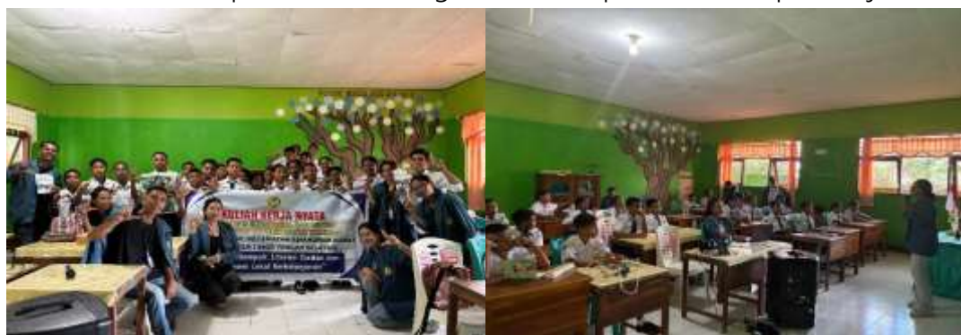
Gambar 2. Sosialisasi di SMPN Satap Oeusapi

informasi dan komunikasi telah memengaruhi cara orang berjudi, mulai dari bentuk permainannya hingga metode pembayarannya (Fakhriansyah & Alwi, 2022). Saat ini, hanya dengan menggunakan ponsel dan jaringan internet, pelaku judi online tidak lagi perlu bertemu secara langsung atau datang ke lokasi perjudian. Secara hukum, praktik perjudian diatur dalam Pasal 303 KUHP mengenai tindak pidana perjudian serta Pasal 303 bis KUHP terkait sanksi pidana bagi pelaku. Selain itu, aturan lebih rinci tercantum dalam Undang-Undang Nomor 11 Tahun 2008 tentang Informasi dan Transaksi Elektronik (UU ITE) beserta perubahan melalui Undang-Undang Nomor 19 Tahun 2016, khususnya pada Pasal 27 ayat (2) dan Pasal 45 ayat (2). Fenomena perjudian tidak hanya melibatkan orang dewasa, tetapi juga remaja, termasuk generasi muda. Aktivitas ini dianggap sebagai salah satu penyakit sosial karena menumbuhkan kebiasaan buruk untuk memperoleh keuntungan besar tanpa usaha maupun kerja keras.