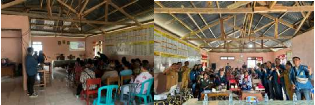
Gambar 3. Sosialisasi di Balai Desa