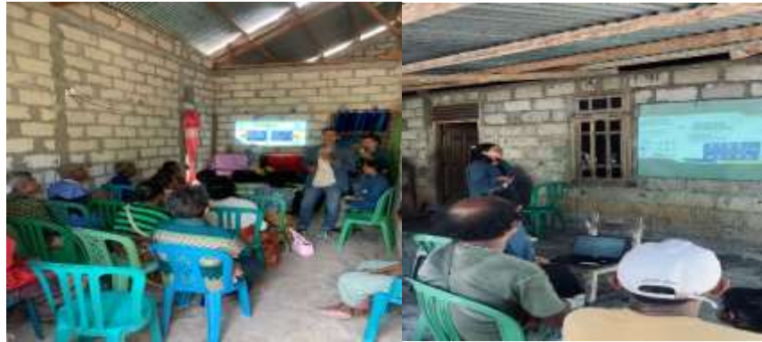
Gambar 4. Sosialisasi di Rumah Warga