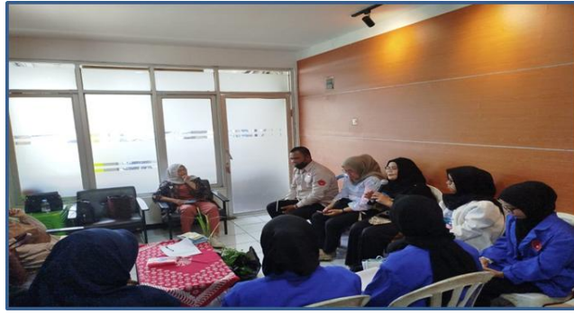
Gabar 3 Saat Pengenalan materi