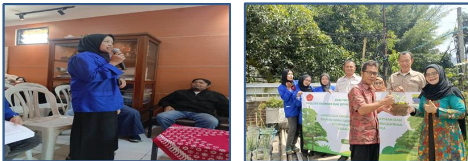
Gambar 5 Penjelasan Pelaksanaan.

Sebagai tindak lanjut, tim pengabdian akan menyediakan pendampingan untuk peserta yang berminat mengembangkan usaha hijau mereka lebih lanjut, serta memberikan dukungan dalam bentuk akses pasar atau pelatihan lanjutan jika diperlukan.