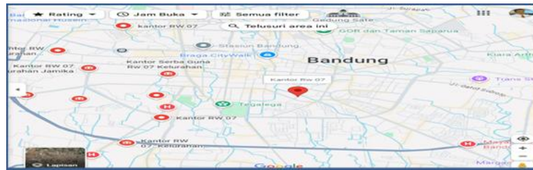
Gambar 2 Peta Lokasi RW 07 Kelurahan Balonggede

Dengan mempertimbangkan keberagaman latar belakang dan potensi sumber daya yang ada, program ini dirancang untuk memberikan pelatihan yang dapat langsung diterapkan oleh masyarakat, terutama dalam pengelolaan tanaman sayuran secara organik dan pengembangan usaha berbasis keberlanjutan. Selain itu, program ini juga bertujuan untuk menggugah minat masyarakat yang lebih memilih bisnis konvensional, seperti kos-kosan, untuk mempertimbangkan wirausaha hijau sebagai alternatif yang lebih berkelanjutan dan menguntungkan dalam jangka panjang.