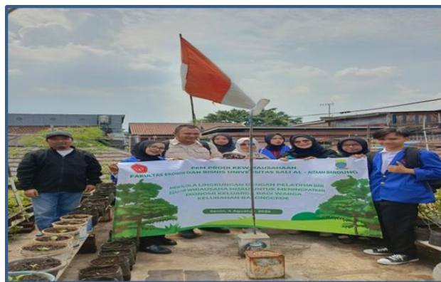
Gambar 4 Memberikan penjelasan tentang manfaat tanaman

Pelatihan ini dilakukan secara langsung di lapangan, sehingga peserta dapat mempraktikkan teknik yang diajarkan dengan menggunakan alat dan bahan yang mudah diakses oleh masyarakat setempat.