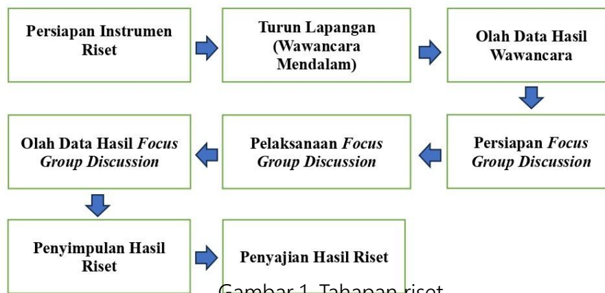
Gambar 1. Tahapan riset