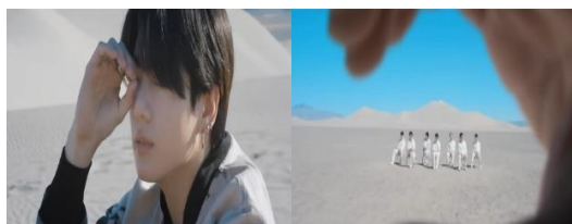
Gambar 2. https://youtu.be/kXpOEzNZ8hQ?si=G4oJhzkUAaBq0pgl