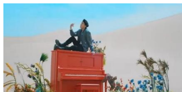
Gambar 9. https://youtu.be/kXpOEzNZ8hQ?si=G4oJhzkUAaBq0pgl