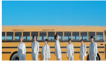
Gambar 16. https://youtu.be/kXpOEzNZ8hQ?si=G4oJhzkUAaBq0pgl

16. Adegan 16 Makna Denotasi, Konotasi, dan Mitos pada gambar 16 pada video klip BTS "Yet to Come". Menit 3:40-3-46