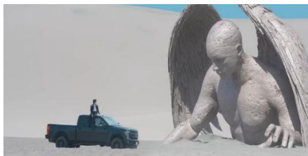
Gambar 7. https://youtu.be/kXpOEzNZ8hQ?si=G4oJhzkUAaBq0pgl