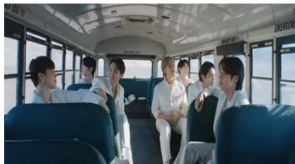
Gambar 7. https://youtu.be/kXpOEzNZ8hQ?si=G4oJhzkUAaBq0pgl

17. Adegan 17 Makna Denotasi, Konotasi, dan Mitos pada gambar 17 pada video klip BTS "Yet to Come". Menit 3:56-4:22