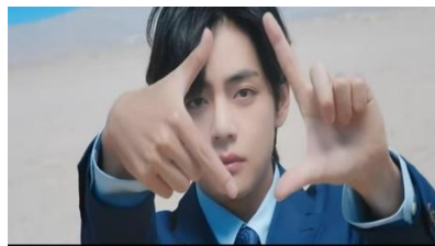
Gambar 15. https://youtu.be/kXpOEzNZ8hQ?si=G4oJhzkUAaBq0pgl

15. Adegan 15 Makna Denotasi, Konotasi, dan Mitos pada gambar 15 pada video klip BTS "Yet to Come". Menit 3:37-3:39