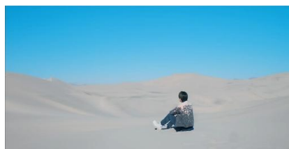
Gambar 1. https://youtu.be/kXpOEzNZ8hQ?si=G4oJhzkUAaBq0pgl