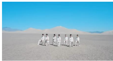
Gambar 3. https://youtu.be/kXpOEzNZ8hQ?si=G4oJhzkUAaBq0pgl

Denotasi Memperlihatkan anggota BTS dengan formasi lengkap terlihat tengah duduk berjajar rapi dikursi dengan pakaian dan celana serba putih. Mereka berada ditengah hamparan gurun pasir yang luas dengan latar langit biru yang cerah.