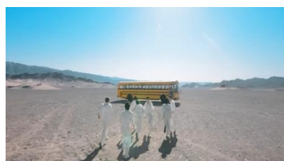
Gambar 14. https://youtu.be/kXpOEzNZ8hQ?si=G4oJhzkUAaBq0pgl