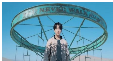
Gambar 6. https://youtu.be/kXpOEzNZ8hQ?si=G4oJhzkUAaBq0pgl

Denotasi Pada adegan ini terlihat Jungkook sedang berdiri di depan karusel tua dan rusak yang bertuliskan “You Never Walk Alone”. Pandangannya menatap lurus ke kamera dengan ekspresi tenang dan serius.