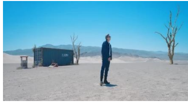
Gambar 10. https://youtu.be/kXpOEzNZ8hQ?si=G4oJhzkUAaBq0pgl

10. Adegan 10 Makna Denotasi, Konotasi, dan Mitos pada gambar 1.10 pada video klip BTS "Yet to Come" . Menit 2:12-2:21