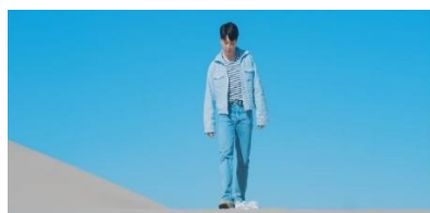
Gambar 8. https://youtu.be/kXpOEzNZ8hQ?si=G4oJhzkUAaBq0pgl