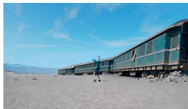
Gambar 11. https://youtu.be/kXpOEzNZ8hQ?si=G4oJhzkUAaBq0pgl

11. Adegan 11 Makna Denotasi, Konotasi, dan Mitos pada gambar 11 pada video klip BTS "Yet to Come" . Menit 2:22-2:32