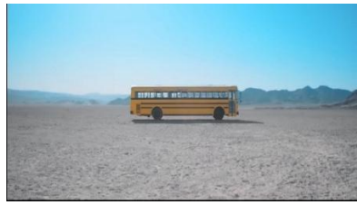
Gambar 13. https://youtu.be/kXpOEzNZ8hQ?si=G4oJhzkUAaBq0pgl