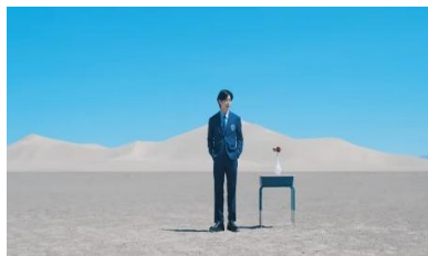
Gambar 5. https://youtu.be/kXpOEzNZ8hQ?si=G4oJhzkUAaBq0pgl