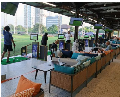
Gambar 2. Driving Range Club de Arjuna

Dikutip dari situs resmi Club De Arjuna (n.d.), tempat ini merupakan fasilitas driving range golf terbaru yang berlokasi di Kedoya, Jakarta Barat, dan mengusung konsep istimewa melalui slogan "Beyond Sportainment". Sejak resmi dibuka pada 5 Juli 2023, tempat ini telah menarik minat para penggemar golf karena menawarkan kombinasi lengkap antara fasilitas olahraga dan hiburan. Kesuksesan Club de Arjuna juga didukung oleh letaknya yang sangat strategis, yakni berada persis di sisi Tol Kebon Jeruk, sehingga mudah diakses dari berbagai arah. Saat memasuki area driving range, pengunjung akan merasakan suasana yang menyerupai lapangan golf sungguhan. Club de Arjuna tidak hanya menampilkan hamparan rumput hijau, tetapi juga dilengkapi dengan elemen visual menarik seperti danau buatan, air mancur, dan bunker area yang menambah kesan alami dan realistis pada lingkungan latihan. Club de Arjuna menawarkan total 50 bay reguler, serta dilengkapi dengan dua ruangan VIP dan dua ruangan VVIP. Ruang VIP dirancang untuk menampung hingga delapan orang, sementara ruang VVIP memiliki kapasitas lebih besar, yaitu hingga 15 orang.