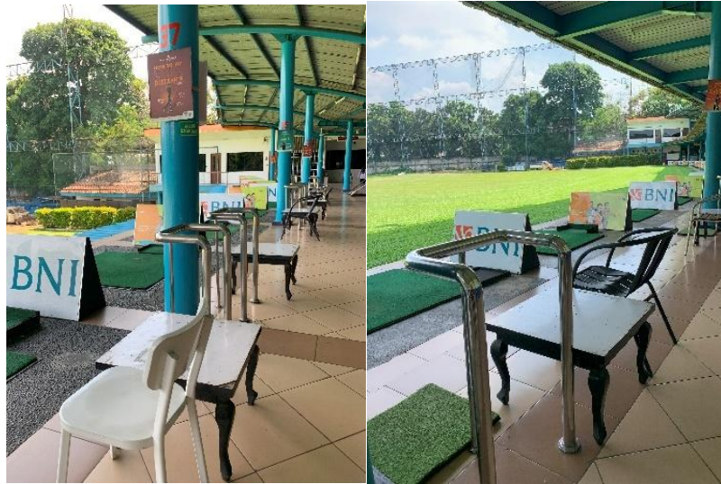
Gambar 7. Area Duduk Driving Range Jakarta Golf Club

menghasilkan pengalaman estetika yang lebih lembut dan mengundang, sebagaimana dijelaskan oleh Vartanian et al. (2015), bahwa bentuk melengkung lebih disukai karena menimbulkan persepsi kenyamanan dan keamanan. Desain ini juga memperkuat suasana tropikal yang diusung oleh bangunan secara keseluruhan, dan mendukung pendekatan Baumgarten tentang pentingnya sensasi inderawi dalam menilai estetika.