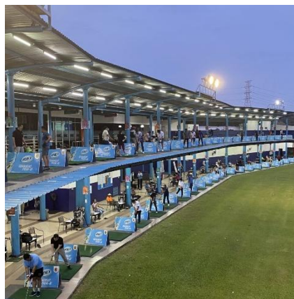
Gambar 3. Driving Range Jakarta Golf Club