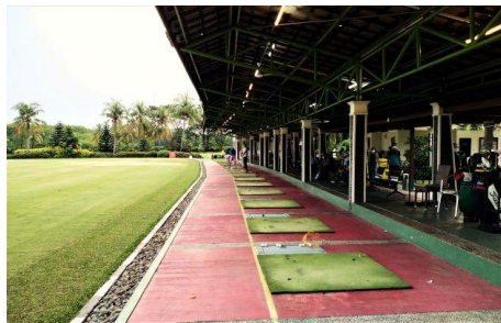
Gambar 1. Driving Range Jababeka Golf & Country Club

Selain di lapangan, golf juga bisa dimainkan pada tempat khusus bernama driving range. Driving range berarti suatu area tempat melatih kemampuan memukul bagi pegolf. Jangkauan dari driving range mungkin memakai rumput biasa, seperti fairway, atau sebagai alternatif, pemain dapat berlatih di matras sintetis yang menyerupai rumput asli (Putranto, 2019). Sebagai salah satu unit hospitality, pelayanan yang disediakan pun beragam. Umumnya, tempat ini mengakomodasi layanan sewa bay, golf academy, serta toko khusus alat-alat olahraga golf (proshop).