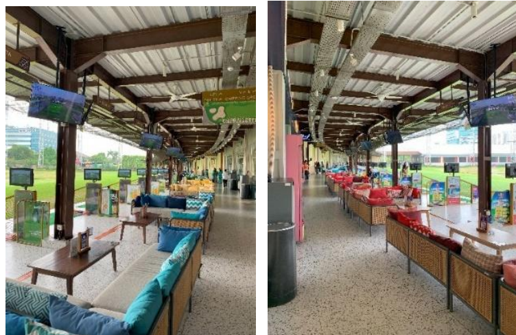
Gambar 6. Area Duduk Driving Range Club de Arjuna

Desain tempat duduk di Jababeka Golf & Country Club menggunakan bentuk persegi panjang dengan sudut tegas dan garis lurus yang konsisten, merepresentasikan gaya minimalis modern. Bentuk dudukan dan sandaran cenderung datar tanpa kontur ergonomis yang kompleks. Komposisi bentuk ini mencerminkan kesan formal, bersih, dan terstruktur, tetapi juga terkesan kaku dan kurang ekspresif secara emosional. Seperti dinyatakan oleh Wong (2016), bentuk persegi dan garis lurus dapat memberikan rasa stabil dan teratur, namun cenderung membatasi ekspresi afektif. Dalam konteks estetika Baumgarten, tempat duduk ini mengedepankan logika visual tetapi minim sensasi inderawi yang hangat.