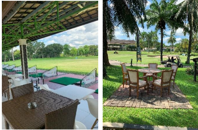
Gambar 5. Area Duduk Driving Range Jababeka Golf & Country Club