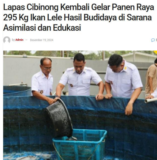
Gambar 1. 2 Hasil Produksi Budidaya Lele di Lapas IIA Cibinong

Menurut informasi dari Badan Pusat Statistik (BPS) tahun 2023, yang memuat data produksi ikan konsumsi sesuai kategori jenis ikan di Kabupaten Bogor, produksi ikan lele menunjukkan dominasi yang sangat signifikan dibandingkan jenis ikan lainnya. Produksi ikan lele mencapai angka tertinggi, yaitu 90.527 ton, jauh melampaui produksi ikan nila (12.782 ton), ikan mas (11.389 ton), dan ikan gurame (5.513 ton).