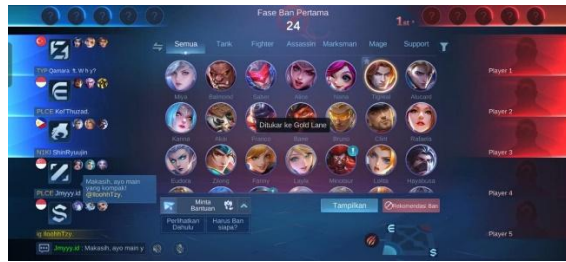
Gambar 1. Diskusi pemilihan Role dan Gaya bermain

Pola komunikasi antar pemain Mobile Legends: Bang Bang pada kelompok mabar di Kelurahan Rejomulyo menunjukkan keragaman yang sangat dipengaruhi oleh role dan gaya bermain masing-masing individu. Irsyad, sang jungler , menerapkan pola chain yang tegas dan satu arah untuk menjaga kontrol penuh, sementara Mukti sebagai mid laner mengutamakan pola Y yang kooperatif dan terbuka, menekankan diskusi dan distribusi informasi dua arah. Anugrah, yang berperan sebagai roamer , menggunakan pola all-channel , aktif membangun suasana suportif dan merata ke seluruh anggota tim. Dimas, sang EXP laner, memakai pola circle yang sabar dan harmonis, menjaga alur informasi tetap berputar merata meskipun sering solo lane . Terakhir, Ardi sebagai gold laner menerapkan pola Y yang fleksibel dan semi-agresif, memprioritaskan jalur kunci sambil tetap responsif saat butuh backup.