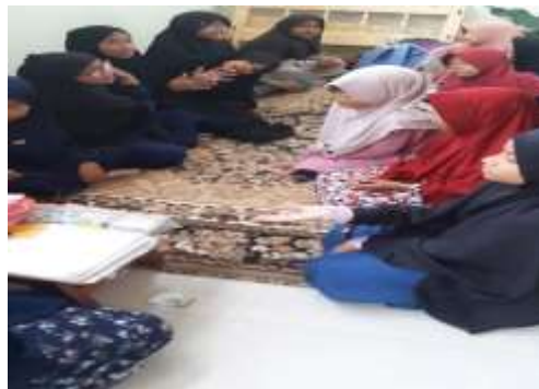
Gambar 2. Demonstrasi Menghafal Hadis Dengan Gerakan.