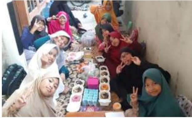
Gambar 3. Pembagian Reward.

Kegiatan implementasi metode gerakan dan reward dilakukan pada akhir kegiatan dengan tujuan dapat memberi reward pada anak yang dapat menyetorkan hadis dan pulang terlebih dahulu sehingga anak lebih bersemangat dan berlomba-lomba dalam menghafal hadis. Metode gerakan yang digunakan juga mendorong anak untuk melakukan kegiatan agar tidak membosankan serta dapat memberikan pemahaman kepada anak makna hadis yang telah dihafal.