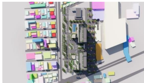
Gambar 5 Lay Out Site Plan

Konsep dasar perancangan City Hotel ini memiliki tujuan utama dalam perancangannya, yaitu bangunan dengan mengikuti tingkat perkembangan yang sekarang sudah bisa dibilang kecanggihan dan kemewahan. Selain itu hotel ini bisa menampung pengunjung yang datang dengan keperluan masing-masing, ada yang berbisnis, wisata dan lain-lain.