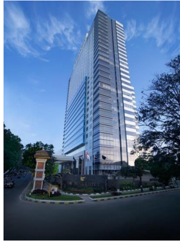
Gambar 1 Perspektif Hotel Jw Marriot