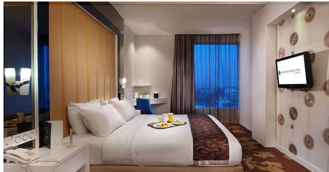
Gambar 13 Interior Excecutive Room

Pemilihan warna pada bangunan merupakan salah satu komponen yang penting. Penggunaan warna-warna alam seperti coklat muda, biru langit dan juga abu-abu secara tidak langsung dapat memberikan ketenangan bagi penghuni kamar.