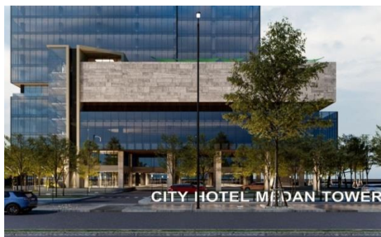
Gambar 9 Perspektif Eksterior

Penggunaan elemen-elemen sederhana seperti elemen garis-garis dan juga pemilihan warna netral dengan tetap menjaga nilai estetika dari arsitektur modern itu sendiri.