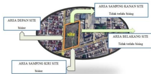
Gambar 3 Analisa Kebisingan

Sumber kebisingan terbesar terletak pada depan dan samping kanan tapak, yaitu dari pemukiman serta jalan akses utama. Sedangkan kebisingan dari arah lain tidak mengganggu kenyamanan tapak dalam perancangan nanti. Area belakang tapak, tidak terlalu bising, karena ada space tapak kosong yang membatasi antara jalan dan site, sedangkan samping kiri site ada pertokoan dan KFC yang dimana tidak terlalu bising karena berada dalam bangunan.