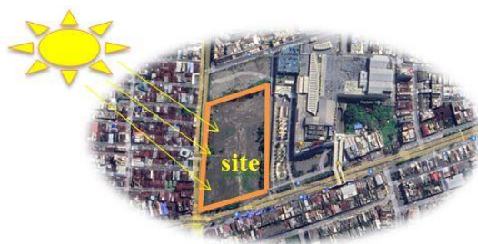
Gambar 4 Analisa klimatologi

Dengan perencanaan City Hotel di tengah kota medan akan sangat baik jika di bangunannya dibuat bertingkat, sehingga dapat menerima cahaya sinar matahari langsung dari pagi sampai sore.