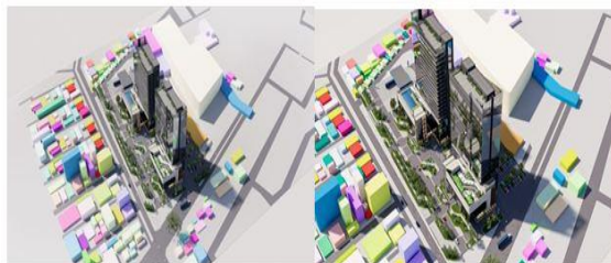
Gambar 6 Gubahan Massa

City Hotel ini dibuat bertingkat, dengan mengikuti klasifikasi dari hotel-hotel city di Medan dengan mengikuti tema aritektur modern.