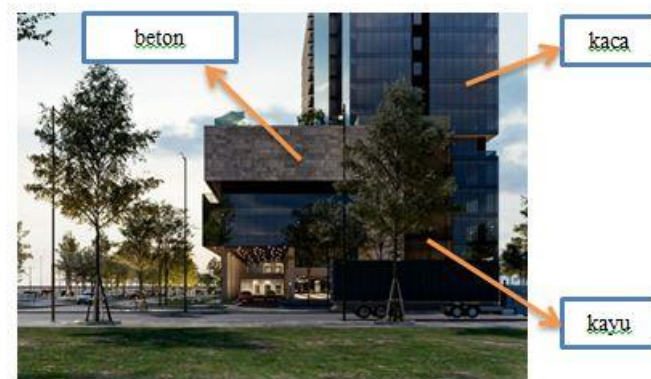
Gambar 10 Penerapan Material Pada Bangunan

menggunakan material seperti kaca yang transparan, besi, beton dan juga baja serta material tradisional seperti kayu