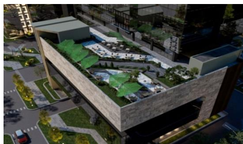
Gambar 11 Penerapan Elemen Hijau

Sesuai klasifikasi city hotel, dengan menambahkan elemen hijau dan elemen air pada rooftop pada hotel ini, hotel menjadi lebih hidup dan segar, sehingga dibuatkan kolam renang yang berada di bagian outdoor bangunan. Selain itu kolam renang menjadi salah satu tujuan bagi para pengunjung yang menginap maupun tidak menginap.