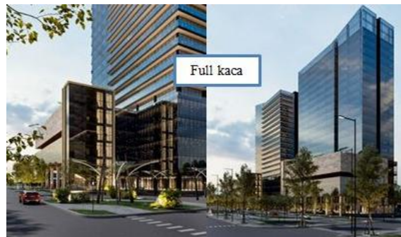
Gambar 8 Perspektif Eksterior