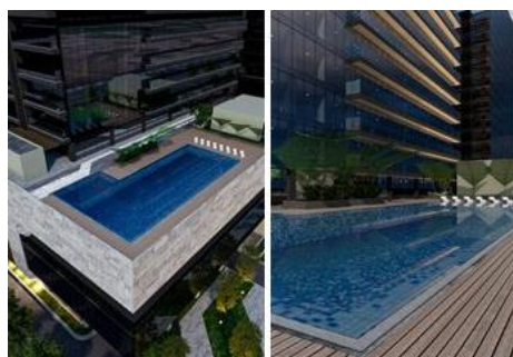
Gambar 12 Penerapan Elemen Air