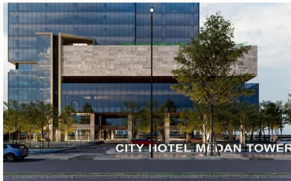
Gambar 7 Perspektif Eksterior