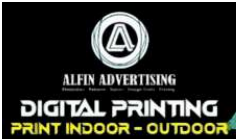
Gambar 1. 2 Logo Alfin Digital Printing

perusahaan saat ini masih terbatas pada penggunaan logo formal tanpa adanya maskot atau elemen visual pendukung yang dapat memperkuat citra brand. Media promosi seperti spanduk, banner, hingga konten digital belum menampilkan maskot sebagai unsur visual yang dapat memperkuat posisi perusahaan di bidang percetakan.