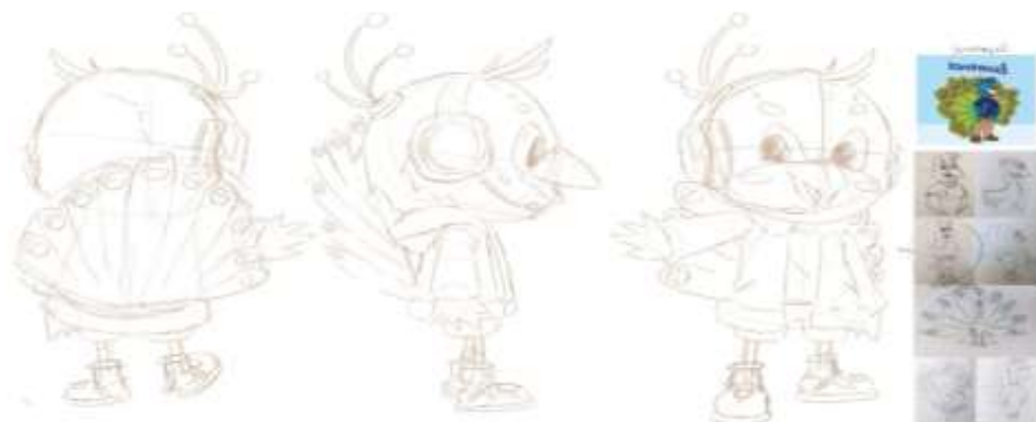
Gambar 1. 5 Sketsa Tampak Posisi Maskot Alfin Digital Printing

Desain layout ini menyajikan beragam variasi ilustrasi maskot burung merak dalam beberapa pose, ekspresi wajah, dan kombinasi warna bulu yang bervariasi. Setiap sketsa menampilkan detail karakter seperti ekspresi ceria, gestur dinamis, serta aksesoris tambahan yang berhubungan dengan dunia digital printing, seperti roll banner mini, lembaran hasil cetak, atau ikon alat percetakan sebagai pelengkap visual. Ilustrasi maskot ini dirancang agar memiliki fleksibilitas tinggi untuk diterapkan dalam berbagai media promosi perusahaan, mulai dari banner, merchandise, platform media sosial, hingga atribut promosi seperti seragam pegawai dan cendera mata. Komposisi visual disusun sedemikian rupa agar mudah digunakan secara konsisten serta efektif dalam memperkuat citra Alfin Digital Printing.