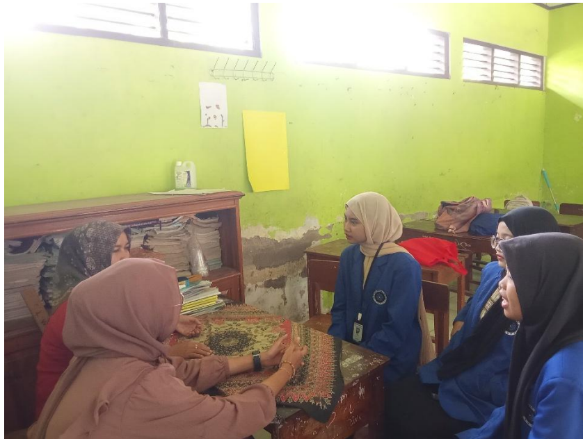
Gambar 1 Wawancara Bersama Guru

Jenis penelitian ini merupakan kualitatif dengan pendekatan studi kasus, sehingga hasilnya berupa data yang terdiri dari kata-kata, baik yang ditulis maupun diucapkan oleh individu, serta perilaku yang dapat diamati. Subjek dalam penelitian ini melibatkan beberapa guru dan siswa. Metode yang digunakan dalam penelitian ini adalah studi literatur atau kajian literatur. Penemuan dari penelitian sebelumnya, atau argumen yang berkaitan dengan topik yang sedang diteliti juga diperhatikan. Setelah data dikumpulkan, peneliti melakukan analisis. Selain itu, metode observasi partisipatif juga diterapkan, dimana peneliti terlibat secara langsung. Dalam penelitian ini, siswa diajarkan tentang pendidikan karakter yang bertujuan untuk mengelola emosi mereka, agar dapat mengekspresikan perasaan dengan baik tanpa menyakiti diri sendiri dan orang lain, serta mengembangkan karakter yang baik dan bijaksana di kalangan peserta didik di kelas 3 SDN 1 Perbetulan.