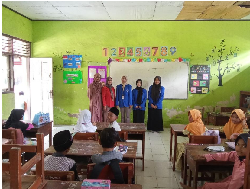
Gambar 1 Foto Bersama

keterampilan sosial emosional yang mendukung interaksi positif di lingkungan sekolah. Lingkungan pendidikan dan metode pengajaran yang diterapkan sangat berpengaruh terhadap perkembangan emosi ini.