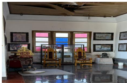
Gambar. 2 Salah satu sudut Puri Klungkung

Kondisi Puri Klungkung menghadapi tantangan besar terutama pelestarian peninggalan sejarah. Terjadi penurunan pendapatan yang signifikan akibat berkurangnya kunjungan ke Puri Klungkung. Terlihat juga beberapa spot disana juga mengalami kerusakan dan perlu dilakukan revitalisasi bangunan fisik.