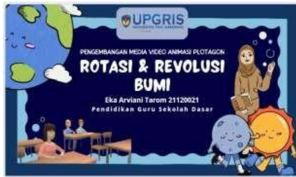
Gambar 4. Sampul Depan Media Video Animasi Plotagon