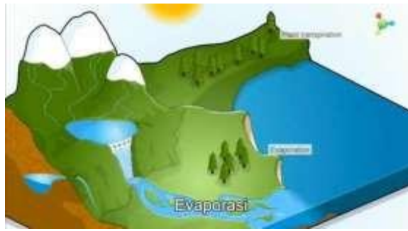
Gambar 3. Contoh dari Materi

Selain membahas materi juga terdapat contoh materi dari Rotasi dan Revolusi Bumi yang berhubungan dengan kegiatan sehari-hari atau yang pernah dialami oleh siswa tersebut dengan diperjelaskan melalui urutan terjadinya peristiwa itu berurutan dan secara jelas.