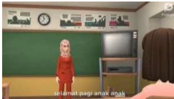
Gambar 1. Opening

Di dalam perancangan media video animasi plotagon terdapat opening yang berisikan salam perkenalan Guru untuk membuka pembelajaran pada materi dari Rotasi dan Revolusi Bumi selain itu terdapat musik instrumen” sebagai tambahan dalam opening tersebut.