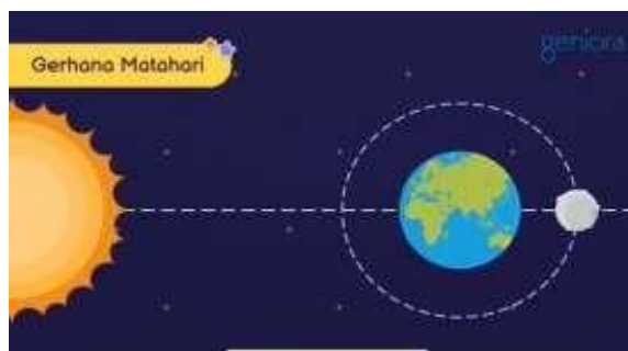
Gambar 2. Penjelasan Materi

Materi yang terdapat di dalam video animasi plotagon menjelaskan tentang Rotasi dan Revolusi Bumi di mana di dalam video tersebut ada tokoh yang berperan sebagai siswa bernama Andin, Dito, Danang, dan Ibu Eka sebagai Guru yang menjelaskan pada materi dari Rotasi dan Revolusi Bumi.