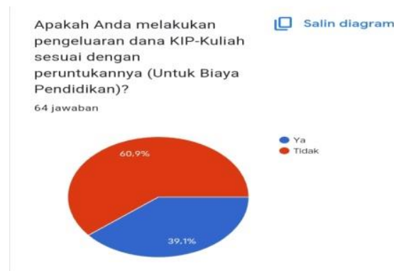
Gambar 1. Presentase Perilaku Keuangan Mahasiswa

diharapkan dapat tepat sasaran kepada penerimanya dan diharapkan Perilaku Keuangan penerima bantuan tersebut terkontrol dan termanajerial dengan baik. Melalui Perilaku Keuangan individu dapat bertanggung jawab serta mempunyai pola hidup yang memiliki prioritas kebutuhan semestinya dan memenuhi keinginan yang tidak bersifat penting. Dengan melihat dari hasil data diatas penulis ingin mengetahui atau melihat Perilaku Keuangan mahasiswa penerima bantuan KIP-Kuliah.