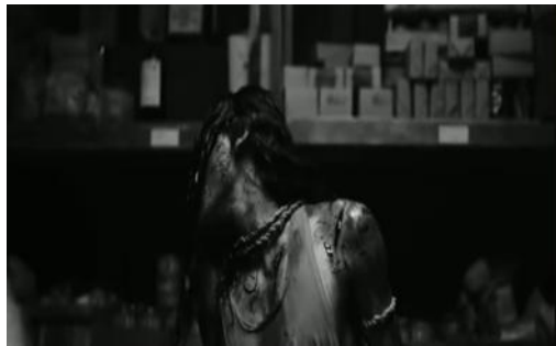
Gambar 5. Penyiksaan Yang Dilakukan Tentara Belanda Ke Pejuang Indonesia

Film The East menampilkan perlakuan kejam terhadap tahanan lokal sebagai gambaran paling eksplisit dari represi kolonial yang sistematis.