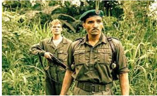
Gambar 1. Seragam Film The East

Tanda 1: Seragam Tentara KNIL (ikon-indeks-simbol)