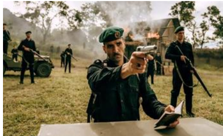
Gambar 3. Tentara KNIL Yang Ingin Mengeksekusi Warga Lokal

Film The East menampilkan senjata dan kekerasan sebagai elemen visual utama yang mencerminkan dominasi kolonial Belanda atas rakyat Indonesia.