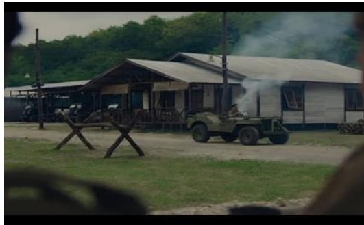
Gambar 2. Pos Penjagaan Belanda