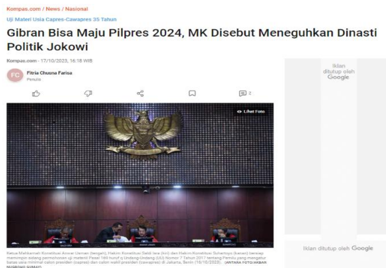
Gambar 1. Berita terkait Dinasti Politik Jokowi di Media Online Kompas.com

Dengan tidak adanya aturan tertulis terkait hubungan keluarga dalam struktur negara, sehingga memberikan ruang sebebas dan seluas itu kepada siapapun yang ingin maju dalam pemilihan, dengan tetap memperhatikan syarat dan ketentuan yang telah ditetapkan lainnya. Tidak luput, tiga faktor hadirnya dinasti politik ialah calon memiliki kelebihan dalam modal, jaringan/relasi, serta posisi dalam kelompok partai (Hidayati, 2014). Berikut gambar terkait pemberitaan dinasti politik pada salah satu media online Indonesia.