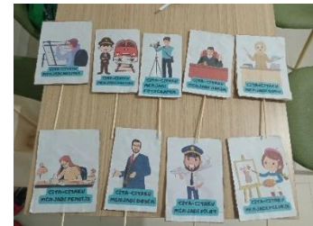
Media Poster Cita-Cita