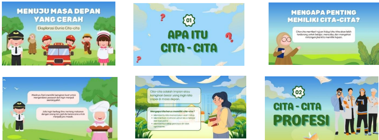
Gambar Media Power Point

pemahaman dan membantu siswa menentukan pilihan karir. Selain menghindari pembelajaran monoton, PowerPoint juga meningkatkan motivasi dan hasil belajar siswa secara kognitif, afektif, dan psikomotorik