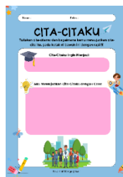
Media Kertas Cita-Citaku