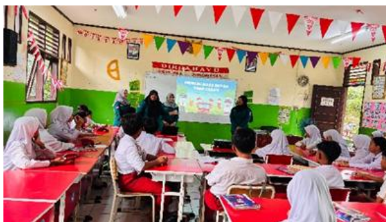
Gambar Dokumentasi Penelitian dalam Penggunaan Media di Kelas V