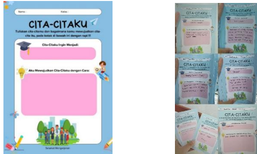
Gambar Lembar Media Kertas Cita-Citaku yang telah di Isi

minat terhadap profesi yang lebih spesifik atau kurang umum, seperti beauty content creator, chef, atau atlet sepatu roda, masih sangat sedikit. Kondisi ini kemungkinan disebabkan oleh keterbatasan wawasan siswa terhadap ragam profesi yang ada atau pengaruh lingkungan dan media yang lebih menonjolkan profesi tertentu.