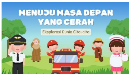
Media Power Point

Teknik analisis data yang digunakan dalam penelitian ini adalah analisis deskriptif secara analitik, yaitu mengungkapkan suatu masalah dan keadaan sebagaimana adanya sehingga hanya mengungkapkan fakta. Proses analisis data dimulai dengan menelaah seluruh data yang diperoleh, baik melalui wawancara ataupun hasil observasi. Kemudian dideskripsikan dengan cara menggunakan analisis persentase (Hartono, 2014) dalam (Sasmita & Karneli, 2020).