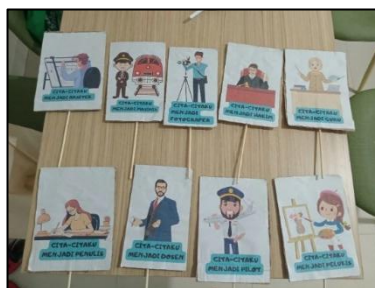
Gambar Media Poster Cita-Citaku

Dengan media visual ini, siswa menjadi lebih aktif, percaya diri, dan mampu membayangkan serta merencanakan cita-cita mereka berdasarkan minat dan hobi. Penggunaan poster interaktif sejalan dengan tujuan pendidikan dasar, yang menekankan keseimbangan pengembangan kognitif, afektif, dan psikomotorik siswa.