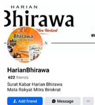
Gambar 2 Akun Facebook Harian Bhirawa