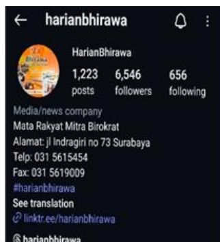
Gambar 1 Akun Instagram Harian

"Bhirawa sebenarnya untuk webnya, bhirawa online itu sudah ada sejak 2008 sampai sekarang terus kita kembangkan."