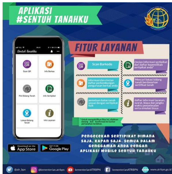
Gambar 1. Fitur Aplikasi Sentuh Tanahku

Selanjutnya dalam aplikasi Sentuh Tanahku dapat juga dilihat tampilan dari aplikasi sentuh tanahku bahwa terdapat batas-batas tanah dari pemiliknya, dan di aplikasi tersebut tidak akan menampilkan tanda apabila tanah yang belum di buatkan dokumen SPH tersebut, apabila tanah tersebut sudah ada pemiliknya maka akan muncul tanda atau pola yang menjadi ciri telah dimiliki seperti yang ditunjukkan pada Gambar 2. Batas-Batas Tanah dalam tampilan Aplikasi Sentuh Tanahku.