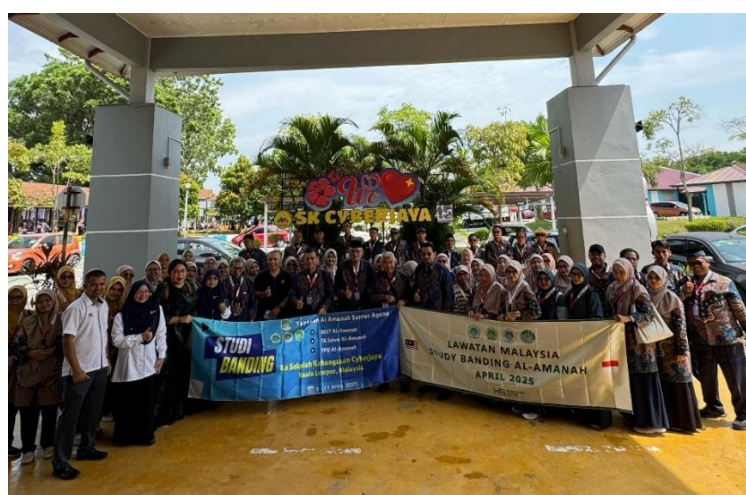
Rombongan Yayasan Al-Amanah Sunter Agung berfoto bersama di depan Sekolah Kebangsaan (SK) Cyberjaya, Malaysia, dalam rangka studi banding pendidikan yang dilaksanakan pada April 2025.

SK Cyberjaya dan Yayasan Al-Amanah menunjukkan bahwa pengelolaan MSDM yang efektif harus mengintegrasikan profesionalisme modern dengan nilai-nilai Islam, tidak hanya pada aspek teknis dan administratif, tetapi juga dimensi moral dan spiritual. Sinergi antara inovasi pedagogis dan spiritualitas Islam menjadi kekuatan transformatif dalam membangun institusi pendidikan unggul dan berkarakter. Sebagai langkah pengembangan, Yayasan Al-Amanah dapat mengimplementasikan program pelatihan berkelanjutan bagi guru dan staf, memperkuat sistem evaluasi kinerja yang konstruktif, serta menjalin kemitraan dengan lembaga lain untuk berbagi praktik terbaik, guna mendukung transformasi MSDM yang berkelanjutan dan relevan dengan konteks lokal.