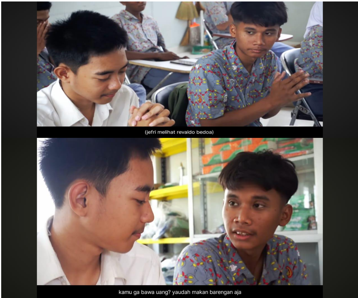
Gambar 2. Suasana Inklusif di Sekolah Baru

Gambar 2 Menunjukkan lingkungan sekolah baru yang digambarkan sebagai ruang yang ramah dan inklusif, di mana perbedaan agama diterima dengan sikap terbuka. Interaksi harmonis antara tokoh utama dan teman-teman barunya mencerminkan suasana saling menghargai dan mendukung, tanpa adanya diskriminasi. Penggambaran ini menegaskan pesan film bahwa keberagaman bisa menjadi kekuatan jika diterima dengan sikap saling menghormati. Penggambaran semacam ini penting dalam membentuk pemahaman remaja tentang menciptakan lingkungan sosial yang toleran dan adil tanpa memandang perbedaan agama.