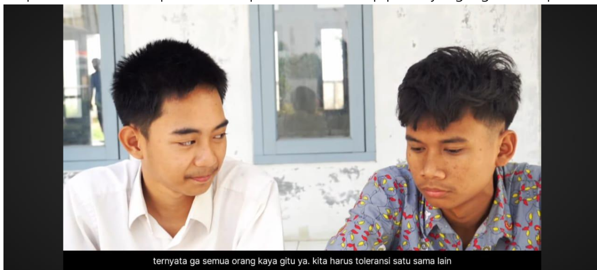
Gambar 3. Ilustrasi Penyampaian Pesan Toleransi dalam Film Pendek

Dalam tabel 3, dapat dilihat beberapa keterbatasan yang ada dalam penyampaian pesan toleransi beragama dalam film Berbeda Tak Apa Bukan. Keterbatasan utama yang ditemukan meliputi durasi film yang singkat, yang menghalangi pengembangan cerita dan konflik yang lebih mendalam, serta minimnya penekanan pada proses internalisasi nilai toleransi oleh tokoh-tokoh lainnya. Penyampaian pesan toleransi yang lebih eksplisit hanya muncul di akhir film, tanpa adanya pengembangan yang lebih kuat dari awal hingga pertengahan film, yang berpotensi membatasi pemahaman penonton terhadap pesan yang ingin disampaikan.