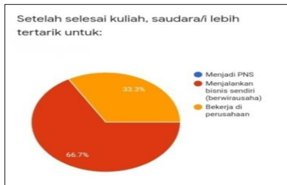
Gambar 2 Student Entrepreneurial Interest Data after Graduating College

Pada diagram tersebut, terlihat bahwa mahasiswa Prodi Ekonomi Syariah ketika ditanyakan apakah setelah selesai kuliah nantinya, lebih tertarik menjadi seorang PNS, ataukah menjalankan bisnis/berwirausaha, ataukah hendak bekerja di perusahaan, ternyata 66,7% menyatakan lebih tertarik untuk menjadi seorang wirausahawan. Namun, jika dilihat dari kondisi pandemi saat ini, banyak usaha yang gulung tikar disebabkan kondisi perekonomian yang melemah, tentu pilihan berwirausaha juga menjadi pilihan yang sangat harus dipertimbangkan. Ditambah lagi, minat berwirausaha yang disampaikan namun belum sampai setengah dari mahasiswa yang pernah menjalankan aktivitas wirausaha sejak berada di bangku perkuliahan. Hal ini kemudian menjadi penguat bahwa minat berwirausaha mahasiswa harus semakin ditumbuhkan agar tujuan dari FEBI IAIN Padangsidempuan dapat direalisasi.