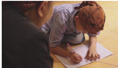
Gambar 11. Penerapan Over the Shoulder

Teknik ini penulis terapkan pada scene 11, di mana posisi kamera berada di belakang bahu guru serta fokus kamera pada murid yang sedang menulis.