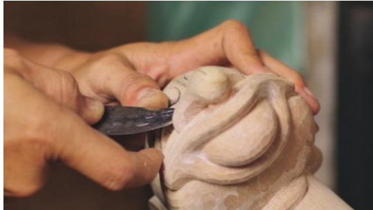
Gambar 8. Big Close Up Mengukir

Pada scene 4 , aktivitas perajin wayang golek yang sedang mengukir ditampilkan menggunakan teknik big close up . Pengambilan gambar ini menonjolkan setiap detail goresan ukiran dan tekstur kayu dengan sangat jelas.