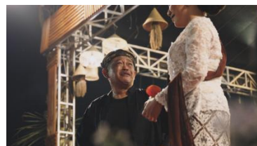
Gambar 2. Penerapan Low Angle

Pada scene 3, penulis menyelipkan footage gimmick antara sinden dan komedian ketika pagelaran. Sudut pandang ini membuat terlihat lebih berwibawa. Selain itu, penggunaan low angle di sini membuat seolah-olah penonton berada di tengah suasana pagelaran