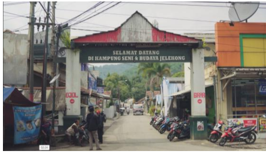
Gambar 5. Gapura Pintu Masuk