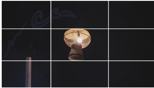
Gambar 10. Penerapan Rule of Third