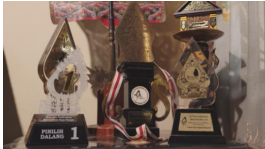
Gambar 13. Penerapan Tilt Up

Tilt up adalah pergerakan kamera dari bawah ke atas pada porosnya. Teknik ini digunakan pada saat mengambil gambar medali sehingga memberikan kesan gagah.