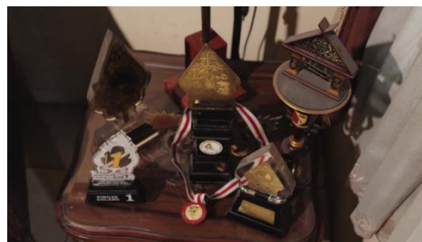
Gambar 1. Penerapan High Angle

Pada scene 12 memperlihatkan berbagai penghargaan yang telah diterima oleh seniman. Dengan sudut pandang ini, semua piala dan medali dapat terlihat dalam satu frame sehingga membantu mengarahkan perhatian penonton langsung ke objek utamanya.