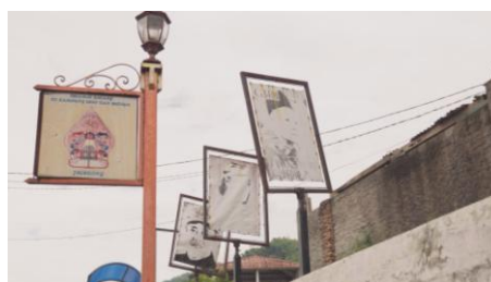
Gambar 13. Dolly Out Tokoh Pedalangan

Dolly out adalah pergerakan kamera menjauhi objek. Penggunaan teknik ini pada saat mengambil gambar para tokoh pedalangan di Giri Harja. Teknik ini menambah kesan dramatis dari visual yang ditampilkan.