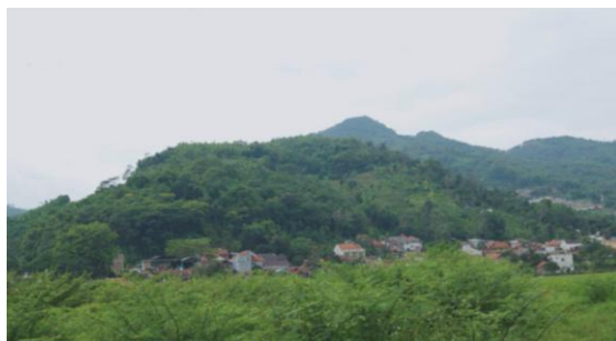
Gambar 9. Very Long Shot Pemandangan

Pada scene 4 , penulis menggunakan teknik very long shot untuk menampilkan pemandangan Kampung Jelekong yang sangat asri. Teknik ini memungkinkan penonton melihat keseluruhan lanskap dengan jelas, menonjolkan keindahan alam yang luas