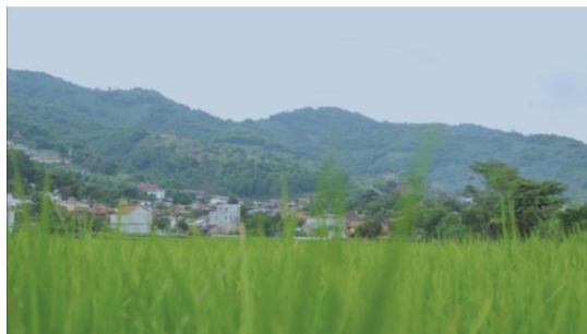
Gambar 13. Pan Left Pemandangan

Pergerakan kamera secara horizontal dari kanan ke kiri pada poros tripod. Pada scene 4 menampilkan pemandangan sawah dan pegunungan yang bergerak secara pan left