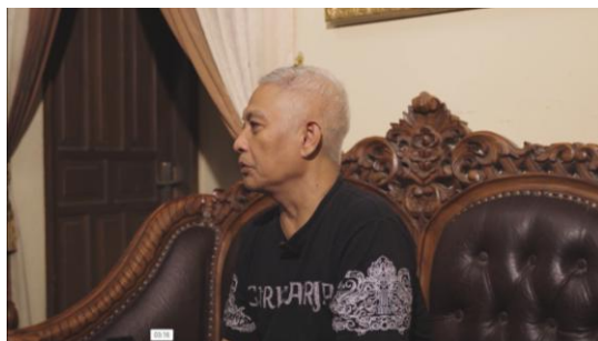
Gambar 6. Medium Close Up

Pengambilan gambar dari batas kepala hingga bagian dada atas. Penulis menggunakan jenis shot size medium close up untuk merekam sesi wawancara bersama ketiga narasumber. Penggunaan shot size ini bertujuan untuk menangkap ekspresi wajah dan detail bahasa tubuh narasumber secara jelas.