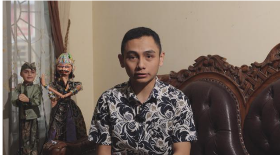
Gambar 3. Penerapan Eye Level

Pada pengambilan gambar saat wawancara dengan semua narasumber penulis menggunakan sudut pandang eye level . Tujuannya yaitu untuk memfokuskan ekspresi dan penjelasan agar dapat tersampaikan dengan baik. Selain itu, sudut pandang ini memberikan kesan netral dan seimbang.