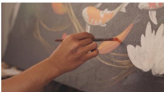
Gambar 7. Close Up Melukis

Pada scene 4 memperlihatkan aktivitas pelukis Kampung Jelekong yang diambil secara close up . Teknik pengambilan gambar ini berfokus pada detail setiap gerakan tangan yang menggoreskan pewarna di atas kanvas.