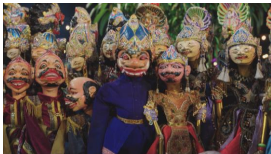
Gambar 4. Jajaran Wayang Golek

Pada scene 3, penulis menampilkan visual jajaran wayang golek di atas panggung pagelaran. Bagian tubuh dari wayang golek yang diperlihatkan hanya sebatas dari kepala hingga pinggang