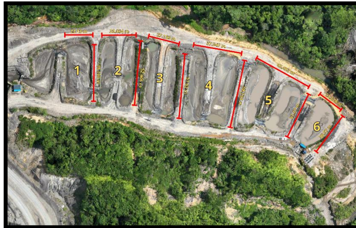
Gambar 1. Settling Pond WCP 4

Pada lokasi penelitian, settling pond WCP 4 pada PT Suprabari Mapanindo Mineral memiliki 6 kompartemen dan memiliki ukuran dimensi sebagai berikut :