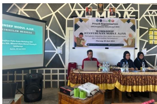
Gambar 3. Pemaparan materi

Penyampaian materi oleh narasumber terkait penyusunan modul ajar meliputi konsep dan komponen-komponen modul ajar. Kemudian dilanjutkan dengan sesi tanya jawab dengan memberikan kesempatan kepada seluruh peserta untuk mengajukan pertanyaan terkait materi yang telah disampaikan. Kegiatan ini dilaksanakan dalam waktu yang telah ditentukan oleh tim pelaksana. Penyampaian materi dan sesi tanya jawab dapat dilihat pada Gambar 3 dan Gambar 4.