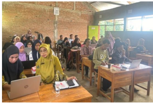
Gambar 4. Sesi tanya jawab