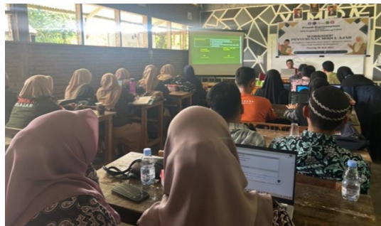
Gambar 5. Praktik penyusunan modul ajar

Setelah peserta workshop menerima materi, dilanjutkan dengan praktik penyusunan modul ajar dan pendampingan oleh tim pelaksana. Modul ajar yang dirancang sesuai dengan bidang studi yang diampu oleh masing-masing guru (peserta workshop). Praktik dan pendampingan penyusunan modul ajar dapat dilihat pada Gambar 5 dan Gambar 6.