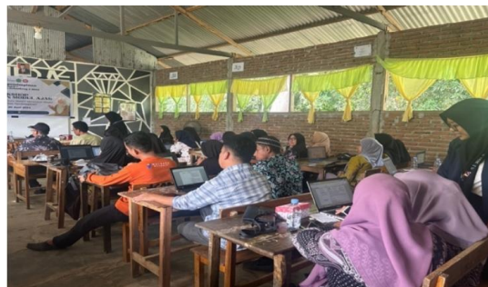
Gambar 6. Pendampingan penyusunan modul ajar