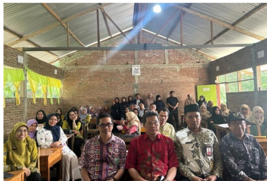
Gambar 8. Dokumentasi bersama narasumber dan peserta

Penyusunan laporan hasil kegiatan sebagai bahan tugas akhir dari kegiatan proyek kepemimpinan. Selanjutnya, tim pelaksana menyusun laporan hasil kegiatan sebagai bentuk pertanggung jawaban dan dokumentasi sehingga pihak terkait dapat mengevaluasi dan memantau pelaksanaan kegiatan serta memberikan umpan balik untuk perbaikan kedepannya. Pada akhir kegiatan, tim pelaksana melakukan sesi foto bersama narasumber dan peserta workshop yang ditunjukkan pada Gambar 8 dan Gambar 9.