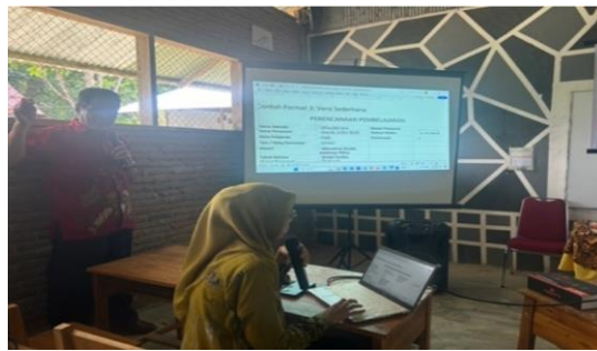
Gambar 7. Presentasi hasil penyusunan modul ajar