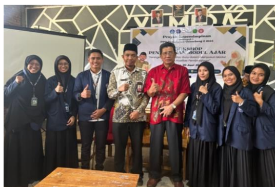
Gambar 9. Dokumentasi tim pelaksana dan narasumber