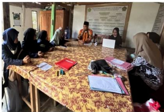
Gambar 2. Wawancara

Analisis dilakukan untuk mengidentifikasi kebutuhan guru dalam mengimplementasikan kurikulum merdeka di sekolah. Analisis kebutuhan ini dilakukan melalui wawancara dengan pihak terkait dan dapat dilihat pada Gambar 2.