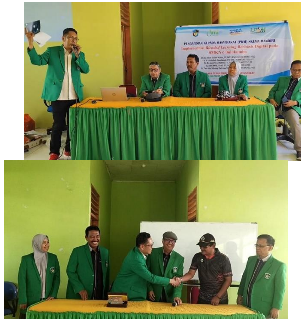
Gambar 3. Pelaksanaan kegiatan PKM