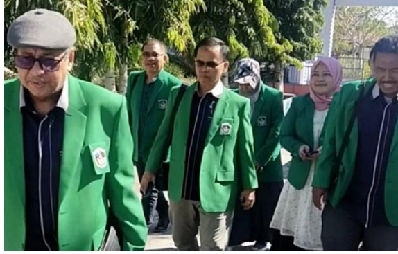
Gambar 2. Pelaksanaan kegiatan awal di lokasi mitra

Tahap berikutnya adalah tahap persiapan materi dan desain kegiatan implementasi blended learning berbasis digital. Tim PKM mempersiapkan materi tertulis dan dalam bentuk slide PPT yang akan dipresentasikan dalam kegiatan. Pada tahap ini, tim PKM menetapkan metode yang akan diterapkan yakni metode ceramah dengan memberikan materi blended learning dan implementasinya dalam pembelajaran, metode diskusi partisipatif, metode praktik dan pendampingan. Di tahap ini tim PKM juga menyiapkan perangkat pendukung pelaksanaan kegiatan PKM yang dibutuhkan seperti contoh modul blended learning dan infocus.