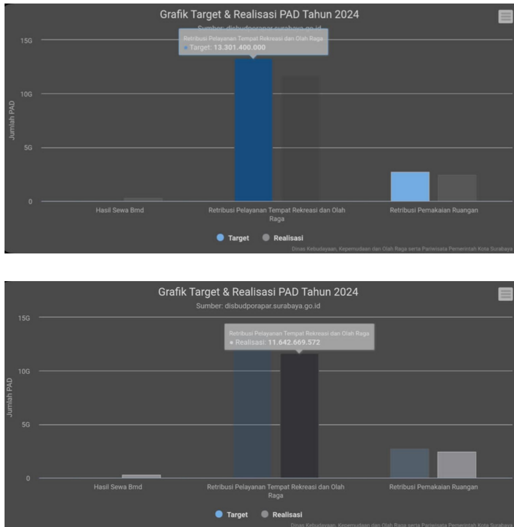
Gambar 1. Grafik target & realisasi PAD tahun 2024