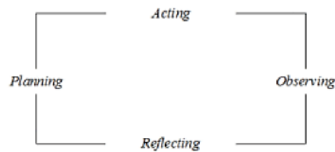
Gambar 1. Model Penelitian Tindakan Kelas Kurt Lewin

saling terhubung. Adapun langkah-langkah tersebut yaitu tahap perencanaan, tahap tindakan, tahap observasi dan tahap refleksi. Hubungan keempat tahapan tersebut yaitu: