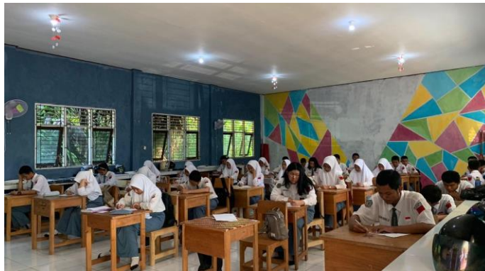
Gambar 2. Proses Pembelajaran Sejarah di Kelas XI SMAN 2 Paringin

Gambar 2. ketika pembelajaran sejarah berlangsung guru memulai dengan tahap pendahuluan, guru memulai pembelajaran dengan apersepsi yang mengajak murid untuk mengulas kondisi geografis daerah sekitar mereka. Guru juga memotivasi murid untuk mengeksplorasi dan mengidentifikasi sumber belajar sejarah di wilayah Balangan, seperti bangunan bersejarah yang berkaitan dengan Perang Banjar. Pada kegiatan inti, penyajian materi dilakukan menggunakan media video pembelajaran yang menampilkan dua peristiwa utama, yaitu Perang Banjar sebagai bagian dari sejarah nasional dan peran Tumenggung Jalil sebagai sejarah lokal. Kedua peristiwa ini dijelaskan secara kronologis untuk memberikan pemahaman yang mendalam tentang perjuangan mempertahankan kemerdekaan Indonesia. Guru juga menekankan pentingnya membandingkan sejarah nasional dan lokal, sehingga murid dapat memahami relevansi keduanya dalam kehidupan saat ini. Sejarah lokal, seperti peran Tumenggung Jalil, membawa nilai-nilai perjuangan dan kepahlawanan yang dapat menumbuhkan nasionalisme, kesadaran sejarah, berpikir kritis, serta semangat gotong royong pada murid. Salah satu warisan bersejarah yang dibahas adalah Benteng Tundakan di Balangan.