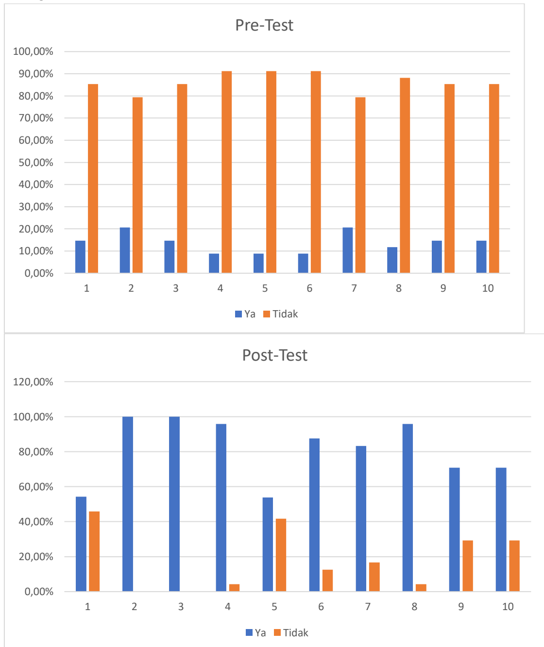
Gambar 2. Hasil Free Test dan Post Test

digunakan oleh guru dalam proses pembelajaran dan mendapatkan respons yang sangat positif dari mereka. Media Educandy menjadi salah satu alternatif inovatif yang direkomendasikan bagi guru untuk menciptakan pembelajaran yang lebih interaktif, menyenangkan, dan efektif di kelas.