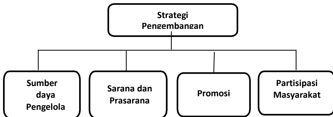
Gambar 1. Kerangka Berpikir