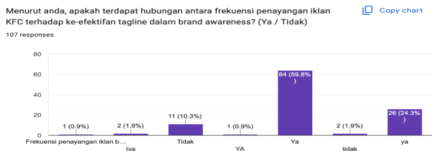
Gambar 31. Persentase Hubungan Frekuensi Penayangan Iklan terhadap tagline dalam Meningkatkan Brand Awareness produk

Salah satu faktor penting yang mempengaruhi seberapa efektif sebuah tagline adalah