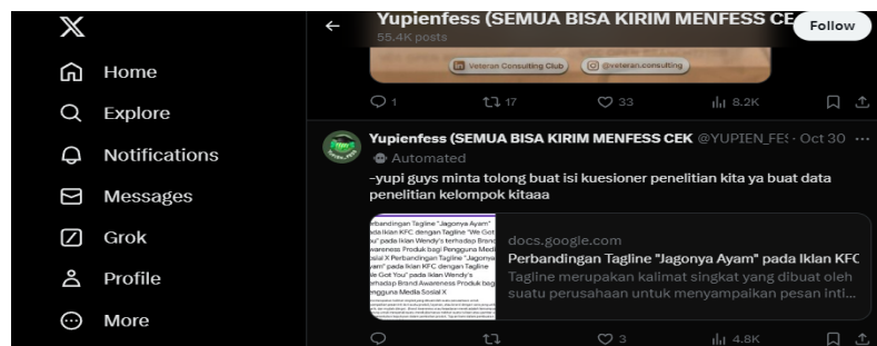
Gambar 1. Pengumpulan Data Melalui Media Sosial X di Laman @Yupienfess