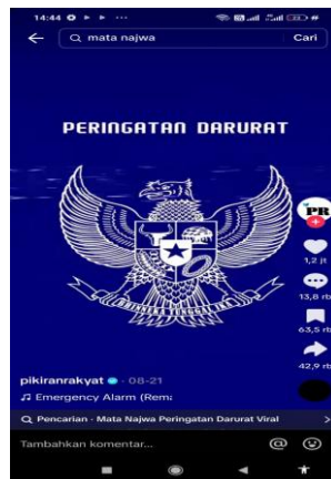
Gambar 1. Postingan Peringatan Darurat Di Akun Tiktok Pikiran Rakyat

Media massa juga merupakan faktor sosial yang sangat kuat dalam mempengaruhi perilaku imitasi. Televisi, media sosial, dan internet menyajikan berbagai macam informasi dan konten yang dapat diakses oleh masyarakat luas dan dapat menyebarkan informasi secara cepat. Seperti postingan peringatan darurat yang diunggah oleh akun media sosial Tiktok bernama Pikiran Rakyat yang telah ditonton lebih dari 13 juta tayangan dan disukai lebih dari 1 juta like, 13 ribu lebih komentar serta telah dibagikan sebanyak 63 ribu kali. Tentunya Paparan yang terus-menerus terhadap tayangan atau informasi tersebut dapat membentuk persepsi masyarakat mengenai keadaan situasi politik Indonesia yang sedang tidak kondusif.