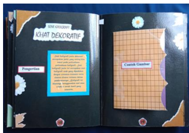
Gambar 11. Tampilan halaman 18 dan 19: Seni Kaligrafi Dekoratif

Elemen judul sebagai identitas halaman, nomor halaman, kotak teks dan gambar yang menjadi fokus utama memberikan informasi mengenai pengertian dan contoh gambar dari seni kaligrafi khat dekoratif. (Gambar 11)