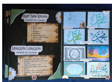
Gambar 13. Alat, Bahan, dan Langkah - Langkah Membuat Kaligrafi Sumber. Dokumentasi peneliti, 2024

Bagian ini bertujuan memberikan gambaran kepada siswa tentang alat dan bahan yang digunakan beserta langkah-langkah pembuatan seni kaligrafi yang mudah dan simpel agar siswa dapat lebih mudah memahami. Pada bagian ini berisi elemen judul sebagai identitas halaman, nomor halaman, kotak teks dan gambar yang menjadi fokus utama memberikan informasi mengenai alat dan bahan, serta gambar langkah demi langkah dalam membuat seni kaligrafi dimulai dengan pembuatan desain dan mempertegas garis sampai dengan membuat bingkai atau background pada karya seni kaligrafi. (Gambar 13)