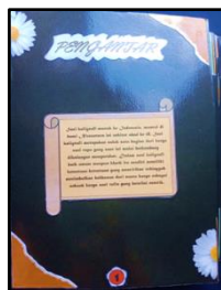
Gambar 2. Tampilan halaman 1: Pengantar

peserta didik agar proses pembelajaran dapat menarik perhatian siswa. Pada halaman 1 berisi elemen judul halaman sebagai identitas halaman, nomor halaman, kotak teks sebagai fokus utama yang berisi penjelasan singkat tentang masuknya seni kaligrafi di Indonesia. (Gambar 2).