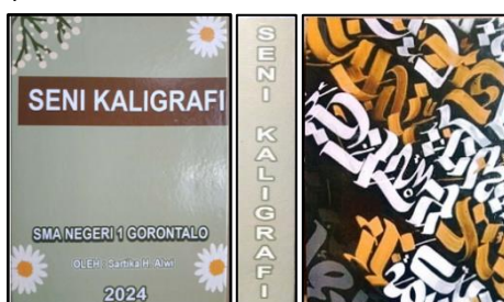
Gambar 1. Tampilan Sampul Media Scrapbook

Bagian sampul merupakan bagian luar media yang berfungsi melindungi dan memberikan informasi awal mengenai isi pada media pembelajaran. Bagian ini berisi informasi tentang judul materi, nama sekolah, nama pengembang dan tahun pengembangan. Selain itu terdapat elemen tambahan berupa gambar bunga daisy pada keempat sudutnya. Sedangkan bagian sampul belakang memiliki motif yang diambil dari gambar seni kaligrafi (Gambar 1)