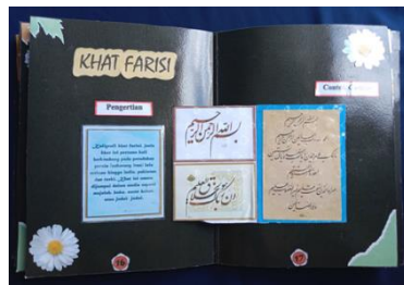
Gambar 10. Tampilan halaman 16 dan 17: Khat Farisi

Elemen judul sebagai identitas halaman, nomor halaman, kotak teks dan gambar yang menjadi fokus utama memberikan informasi mengenai pengertian dan contoh gambar dari huruf seni kaligrafi khat farisi.