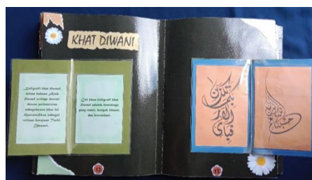
Gambar 8. Tampilan halaman 12 dan 13: Khat Diwani

Elemen judul sebagai identitas halaman, nomor halaman, kotak teks dan gambar yang menjadi fokus utama memberikan informasi mengenai pengertian dan contoh gambar dari huruf seni kaligrafi khat diwani . (Gambar 8)