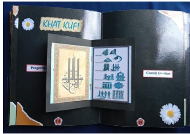
Gambar 9. Tampilan halaman 14 dan 15: Khat Kufi

Elemen judul sebagai identitas halaman, nomor halaman, kotak teks dan gambar yang menjadi fokus utama memberikan informasi mengenai pengertian dan contoh gambar dari huruf seni kaligrafi khat kufi. (Gambar 9)