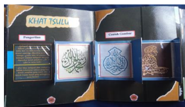
Gambar 7. Tampilan halaman 10 dan 11: Khat Tsuluts

Elemen judul sebagai identitas halaman, nomor halaman, kotak teks dan gambar yang menjadi fokus utama memberikan informasi mengenai pengertian dan contoh gambar dari huruf seni kaligrafi khat tsuluts (Gambar 7).