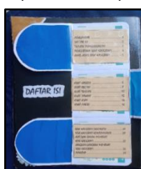
Gambar 3. Tampilan Halaman 2: Daftar Isi

Elemen judul sebagai identitas halaman, nomor halaman, tampilan daftar isi sebagai fokus utama yang menampilkan pembahasan pada setiap lembar dari isi media pembelajaran disertai urutan halamannya (Gambar 3).