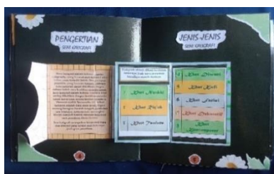
Gambar 4. Tampilan halaman 4 dan 5: Pengertian Seni kaligrafi dan jenis-jenisnya

Halaman selanjutnya berisi tujuan pembelajaran yang bertujuan memberikan informasi tentang tujuan yang akan dicapai dalam pelaksanaan pembelajaran seni kaligrafi.