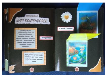
Gambar 12. Tampilan halaman 20 dan 21: Seni Kaligrafi Kontemporer Sumber. Dokumentasi peneliti, 2024

Bagian ini bertujuan memberikan gambaran kepada siswa tentang alat dan bahan yang digunakan beserta langkah-langkah pembuatan seni kaligrafi yang mudah dan simpel agar siswa dapat lebih mudah memahami. Pada bagian ini berisi elemen judul sebagai identitas halaman, nomor halaman, kotak teks dan gambar yang menjadi fokus utama memberikan informasi mengenai alat dan bahan, serta gambar langkah demi langkah dalam membuat seni kaligrafi dimulai dengan pembuatan desain dan mempertegas garis sampai dengan membuat bingkai atau background pada karya seni kaligrafi. (Gambar 13)