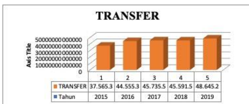
Gambar 5. Rata-Rata Pendapatan Transfer pada Pemerintah Kabupaten/ Kota di Provinsi Jawa Barat Tahun 2015 – 2019 (angka dalam milyar rupiah)

Hasil analisis statistik menunjukkan bahwa variabel pendapatan transfer berpengaruh signifikan terhadap Belanja Modal yang ditunjukkan dengan t-statistik > t-tabel ( 2,569099 > 0,67637 ) dan nilai probabilitas lebih kecil dari tingkat kepercayaan \alpha = 5\% ( 0,0116 < 0,05 ). Hal ini menunjukkan bahwa peningkatan pendapatan transfer mengakibatkan belanja modal yang lebih tinggi, yang sejalan dengan Peraturan Pemerintah Nomor 55 Tahun 2005 yang bertujuan untuk memberikan dukungan keuangan untuk urusan daerah dan mengutamakan sarana dan prasarana pelayanan masyarakat. Di Propinsi Jawa Barat, rata-rata pendapatan transfer ke Pemerintah Kabupaten/Kota adalah sebagai berikut: [masukkan angka.