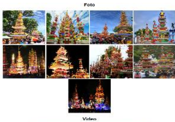
Gambar 9. Galeri

Galeri berisikan foto-foto dari keindahan tabot dengan kreasi masyarakat dan video yang berisikan tentang promosi kemeriahan dan keindahan tabot Bengkulu.