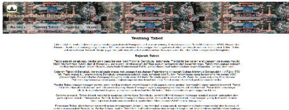
Gambar 7. Tentang Tabot

Di bagian tentang tabot menjelaskan tentang sejarah tabot di Provinsi Bengkulu, Asal usul tabot serta menjelaskan makna yang terkandung dalam setiap prosesi ritual yang dilaksanakan pada tanggal 1-10 muharram dan menjadi wadah untuk melestarikan budaya juga nilai-nilai luhur masyarakat Bengkulu