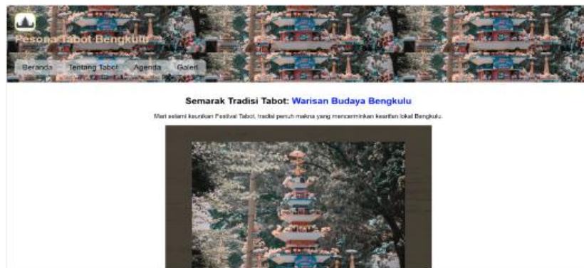
Gambar 6. Beranda

Pada bagian beranda berisi tentang judul website , Gambar yang menarik yang menggambarkan adat Tabot Bengkulu, Slogan yang menarik dan menggambarkan tujuan