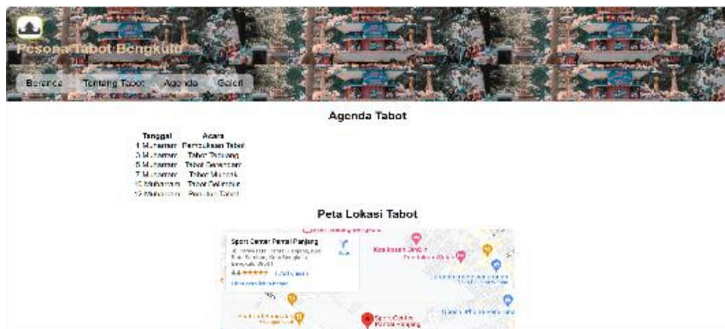
Gambar 8. Agenda

Dibagian Agenda berisikan jadwal acara yang akan dilaksanakan pada tanggal 1 sampai 10 muharram dan peta lokasi tabot yang akan dilaksanakan.