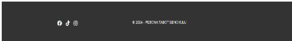
Gambar 10. Komentar dan Grafik Sentimen

Pada ini terdapat kolom komentar dan grafik sentimen dari pengunjung yang telah mengirimkan komentar, komentar ini dapat membantu dalam meningkat kebutuhan yang dibutuhkan pengunjung untuk melihat promosi lokal adat tabot yang ada dikota Bengkulu.